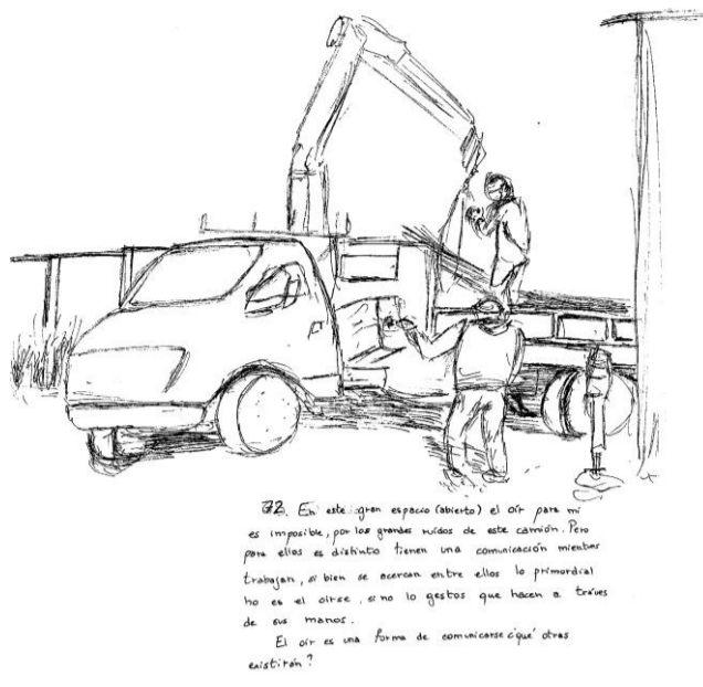
Obs 72. En este gran espacioabierto el oír para mí es imposible, por los grandes ruidos de este camión. Pero para ellos es distinto tienen una comunicación mientras trabajan, si bien se acercan entre ellos lo primordial no es el oírse, si no los gestos que hacen a través de sus manos. ¿Qué otras formas de comunicarse existen?