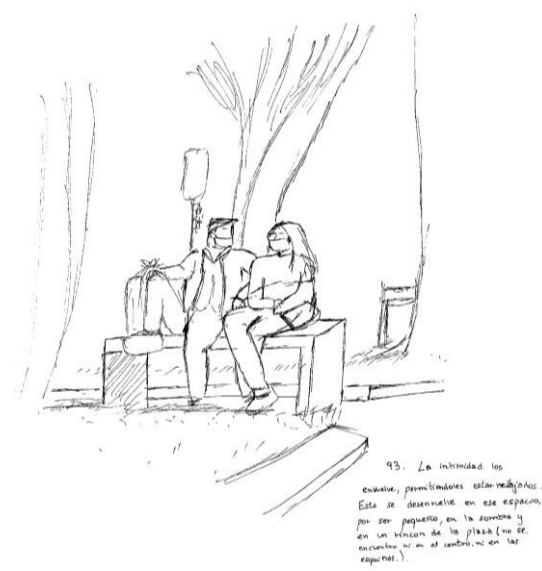
Obs 93. La intimidad no envuelve permitiéndoles estar relajados. Esta se desvuelve en ese espacio, por ser pequeño, en la sombra y en un rincón de plaza(no se encuentra ni en el centro ni en las esquinas)