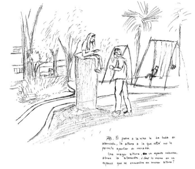
Obs 78. El padre a la niña le da toda su atención, la altura a la que está no le permite apartar su mirada. Una mayor altura, en un espacio reducido atrae la atención. ¿ Será lo mismo en un espacio que se encuentre en menor altura.