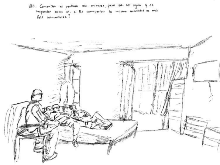
Obs 82. Comentan el partido sin mirarse, pero aun así se oyen y se responden entre sí. ¿ Al compartir la misma actividad es más fácil comunicarse?