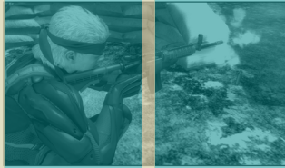
Ornare iaculis odio Urnas: Blandit non Suspendisse: Potenti Nulla: Semper

Quisque congue ipsum sit amet nunc sodales portitor. Suspendisse eros turpis, vulputate in tempus ornare, aliquam a lorem. Ut nec nibh vitae sem ultrices semper. Maecenas portitor facilisis lectus eu aliquam. In massa sodales egestas et blandit sed, mollis quis ligula. Nulla vel dui arcu. Ut non auctor lacus. Mauris in sapien con. Class aptent taciti sociosqu ad litora torquent per conubia nostra, per inceptos himenaeos. Vivamus tempus portitor odio id pretium. Ut nec nibh vitae sem ultrices semper. Maecenas portitor facilisis lectus eu aliquam. In massa sapien, egestas et blandit sed, mollis quis ligula.