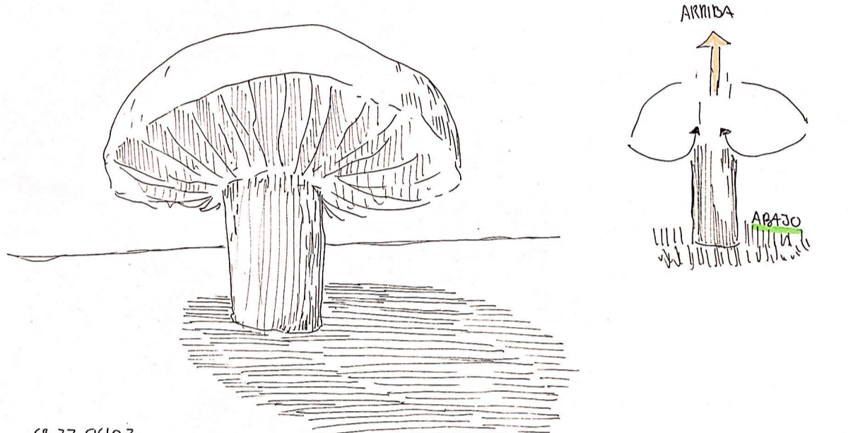
CR.27. CICLO 2. UN HONGO SE SOROTA DESDE UNA ESTRUCTURA VERTICAL COMO EN LA CUAL SE PESA UNA CUBIERTA QUE CONTIENE EL ABISMO HACIA SU CENTRO EN ALTIMA, VENCIENDOSE EN PLO PERMEABILIDAD. RESERVANDO EN SOMBRAS DEL CIELO Y LA LUZ. -ADENTARSE HACIA EL ABISMO MEDIANTE VERTICAL DE CUBIERTA PERMEABLE-