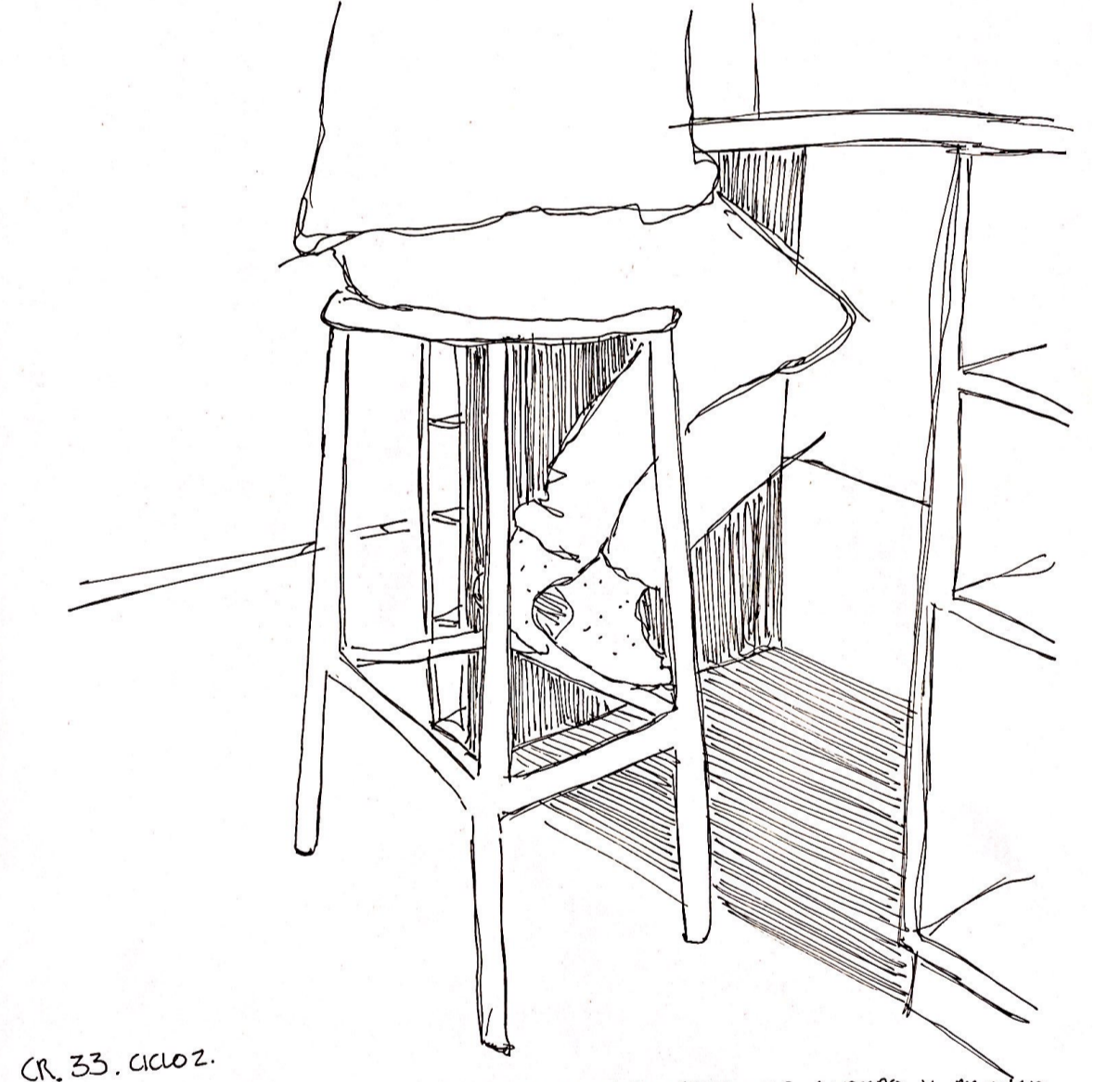
CR.33. CICLO 2. ESTRUCTURA RÍGIDA DE Y APOYO PERMEABLE QUE SOROTA E/C CUERPO Y PROYECTA LA PARTE INFERIOR DE ESTE CON EL VACÍO DEL MUNDO DEL MUEBLE, TAMBIÉN PERMEABLE. ACORDE CANTILEVER ENTRE EL CIELO Y VISUA SOBRE ESTE MUNDO. -PROYECCIÓN DUAL DE VACÍOS ELEVADOS CON LA CANTILEVER DEL ACERVO-