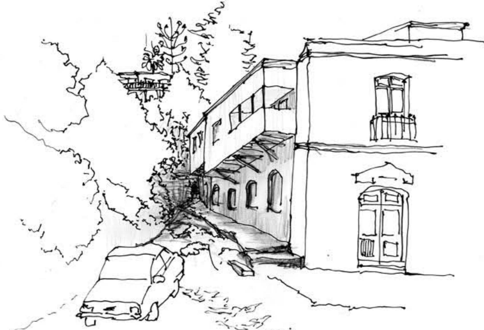
Fondo de quebrada de agua. Espacio residual que da cuenta del origen geográfico del lugar. Es un límite urbano dentro del tejido mismo de ciudad.