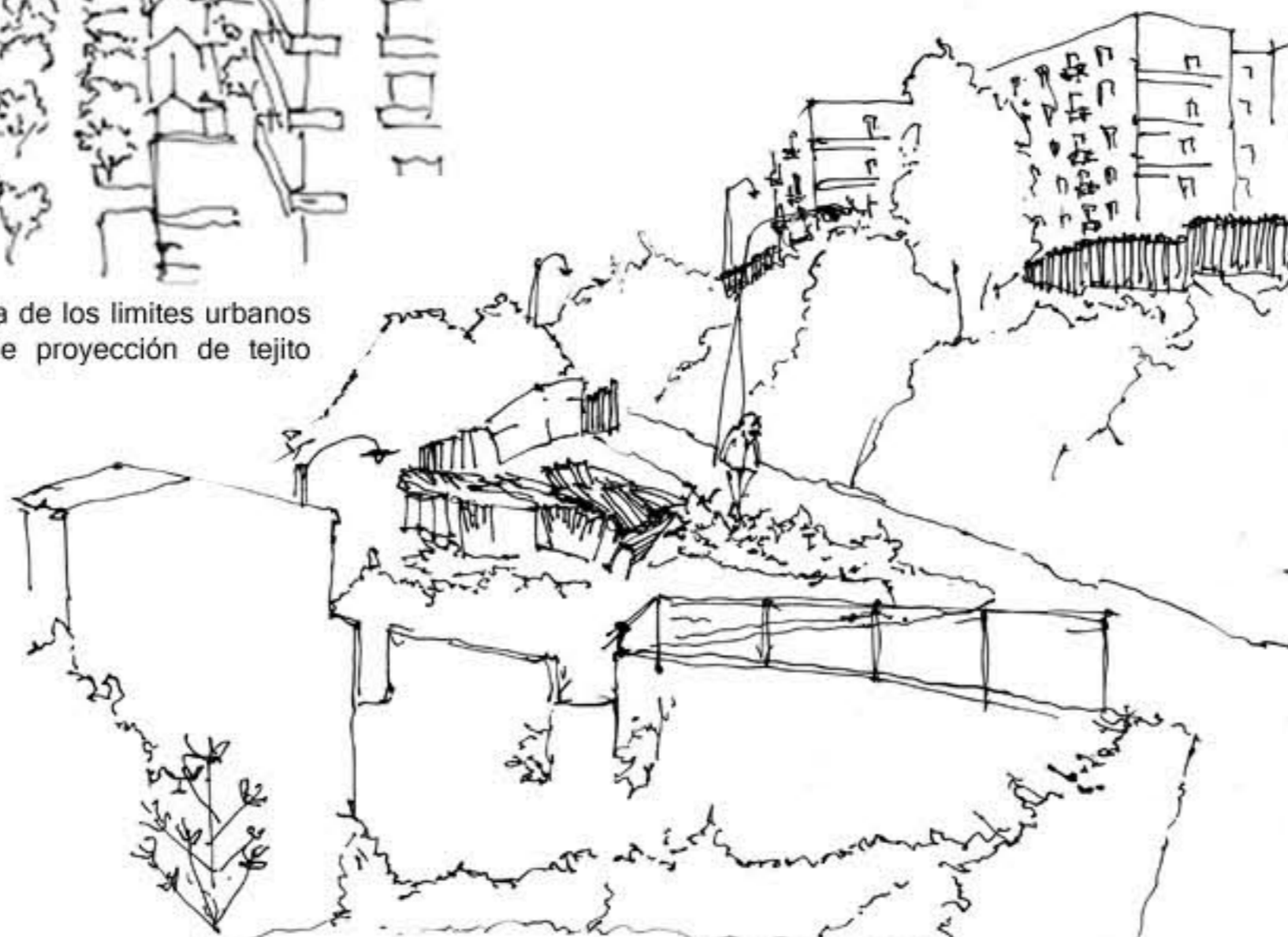
/ El respeto por lo natural evidencia el límite de ciudad que no se alcanza a gobernar