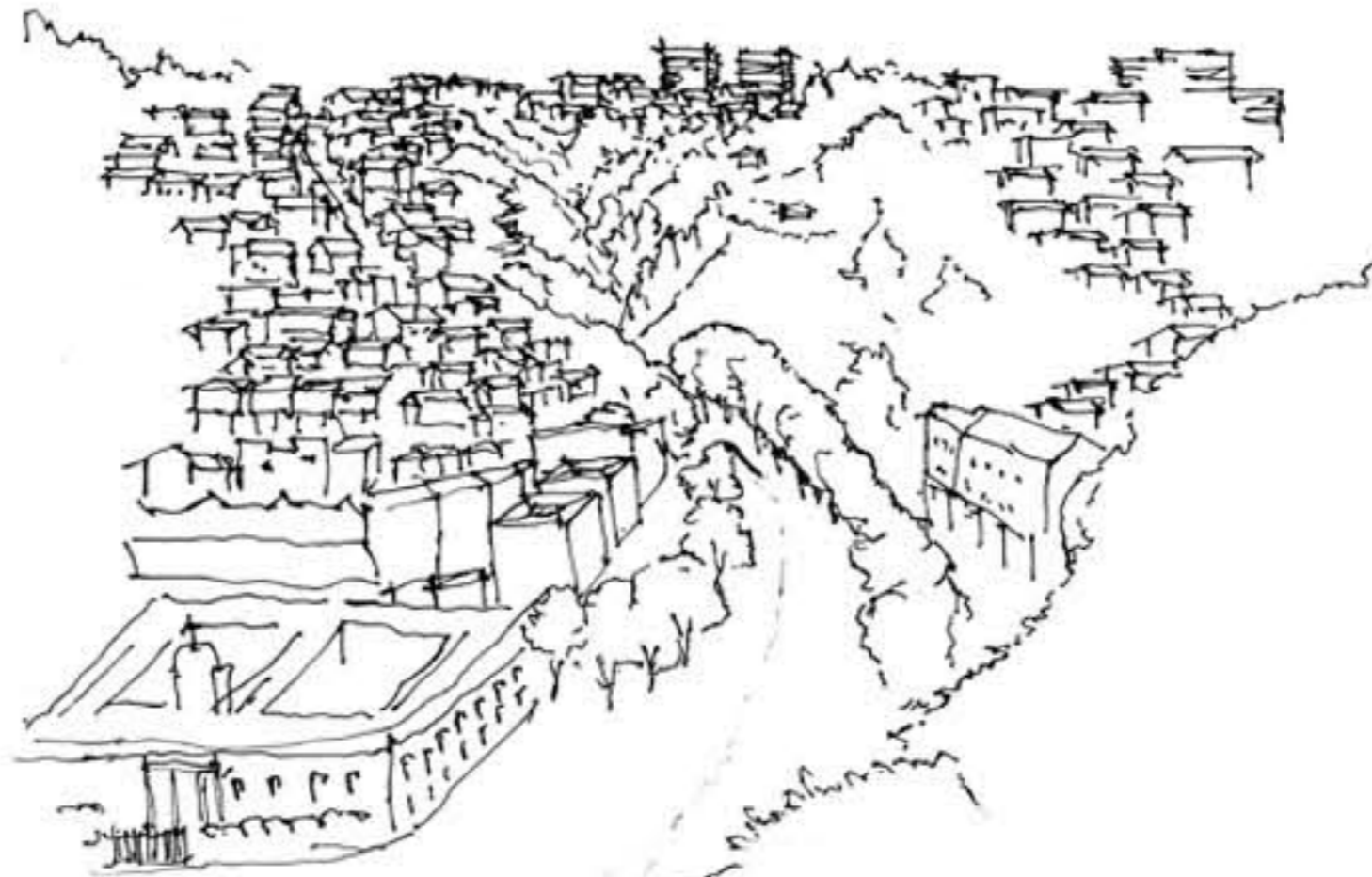
Ciudad segmentada por heridas naturales, Resultan el asentamiento de la ciudad. Permiten una mayor permeabilidad lumínica para los Cerros. Se crea una realidad menos hermética