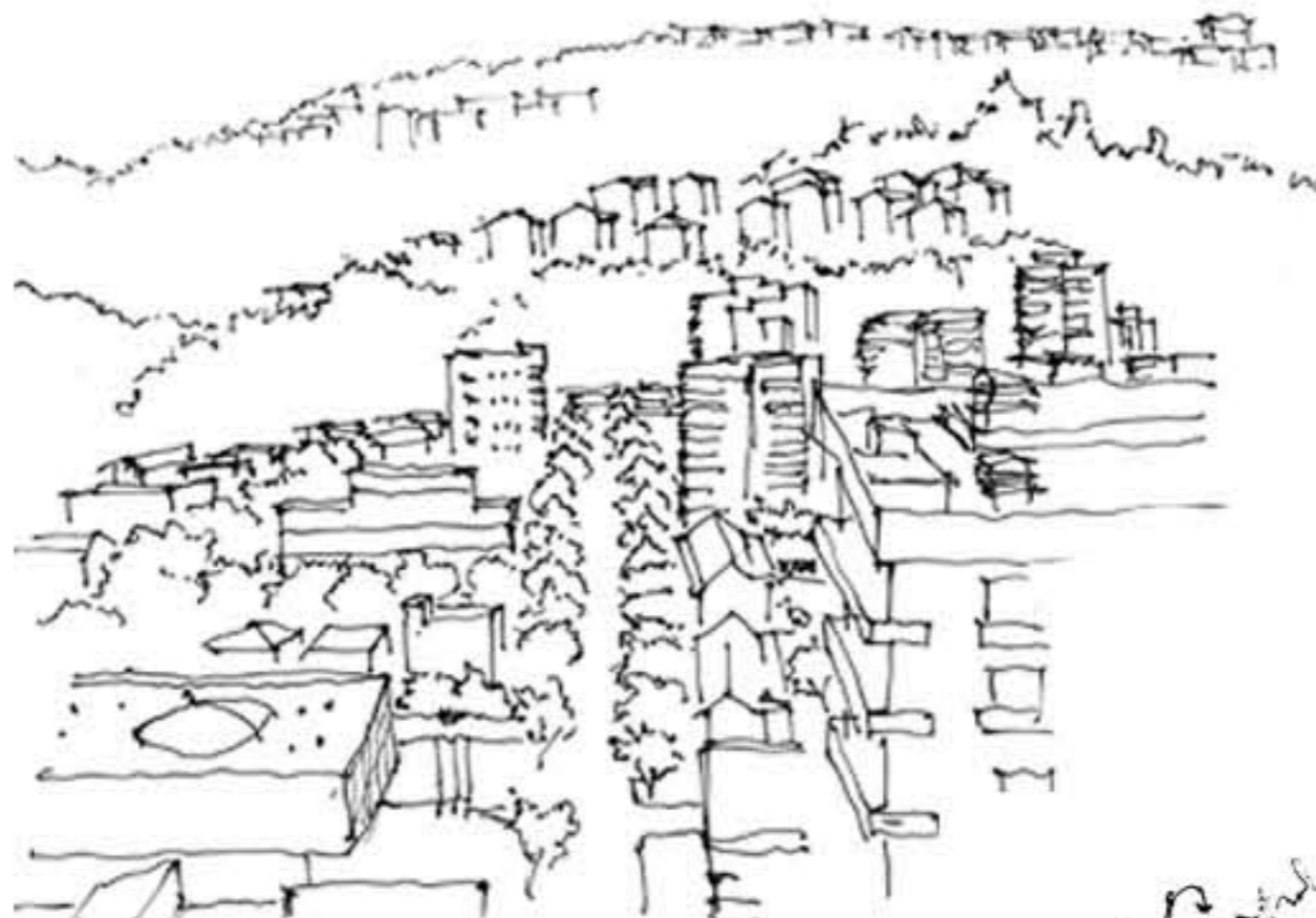
zurcos naturales que dan cuenta de los límites urbanos que deben respetar a modo de proyección de tejido urbano.