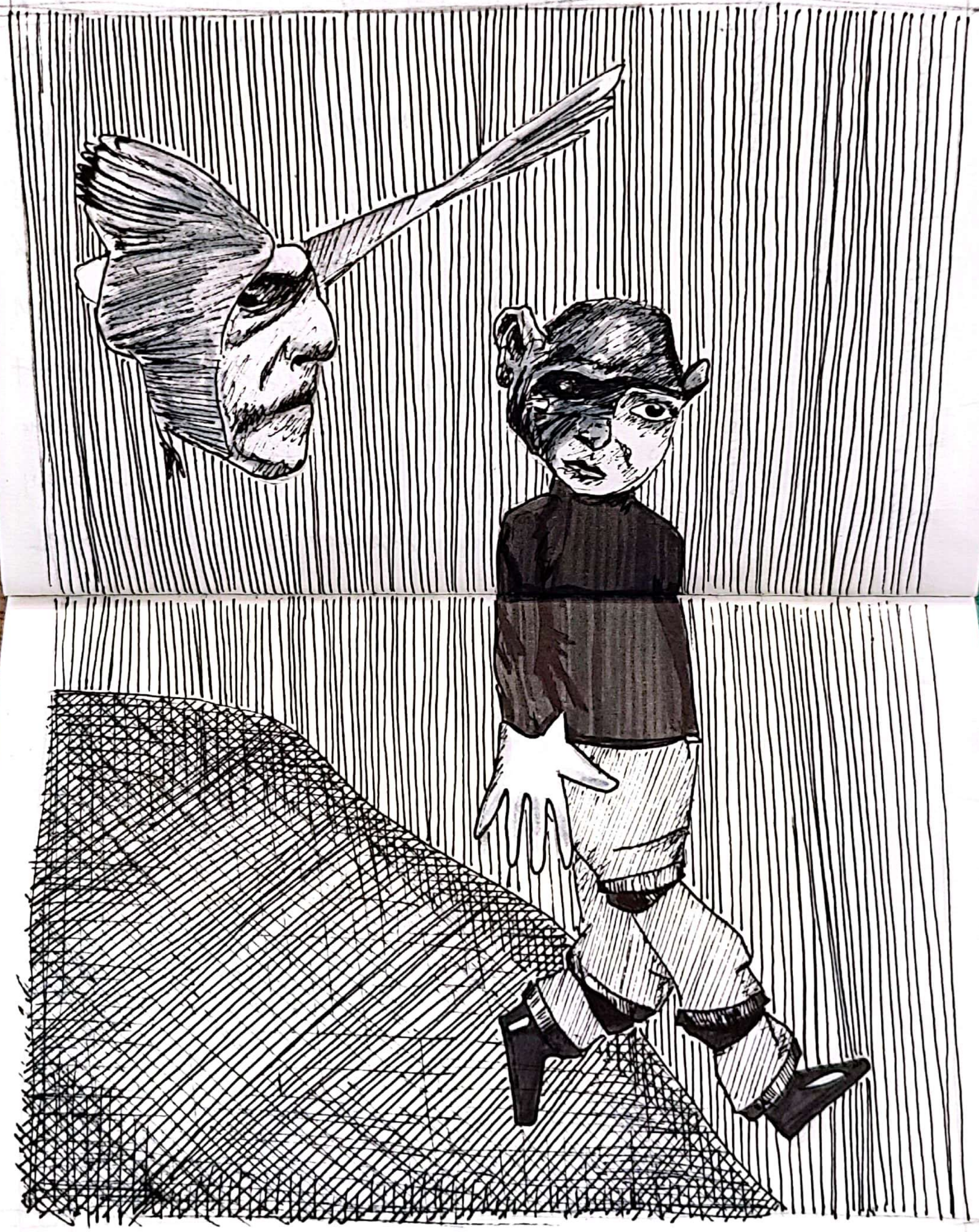
Hannah Höch, Flucht (vuelo), 1931, Collage, fotomontaje, 23 x 18,4 cm