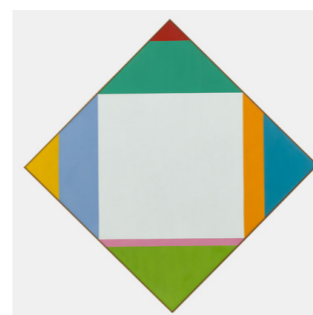
Expansion in Four Directions Max Bill Fecha: 1961 - 1962