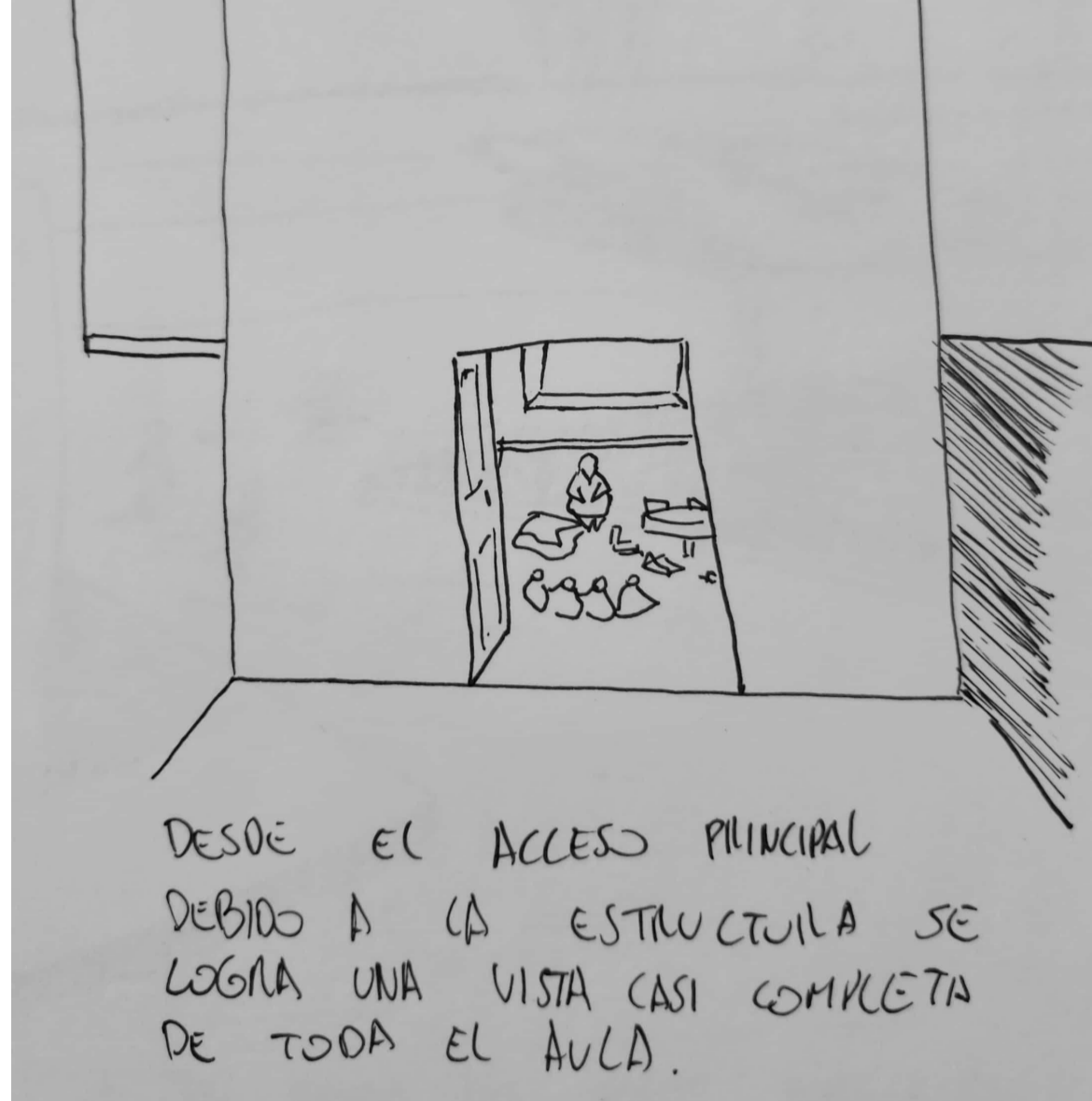
Croquis 3: Acceso hacia el interior del aula.