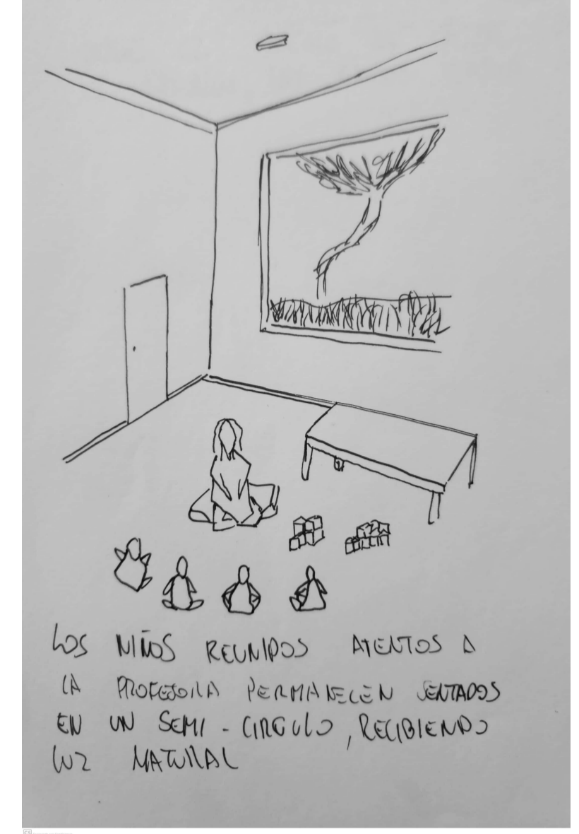
Croquis 4: Interior del aula.