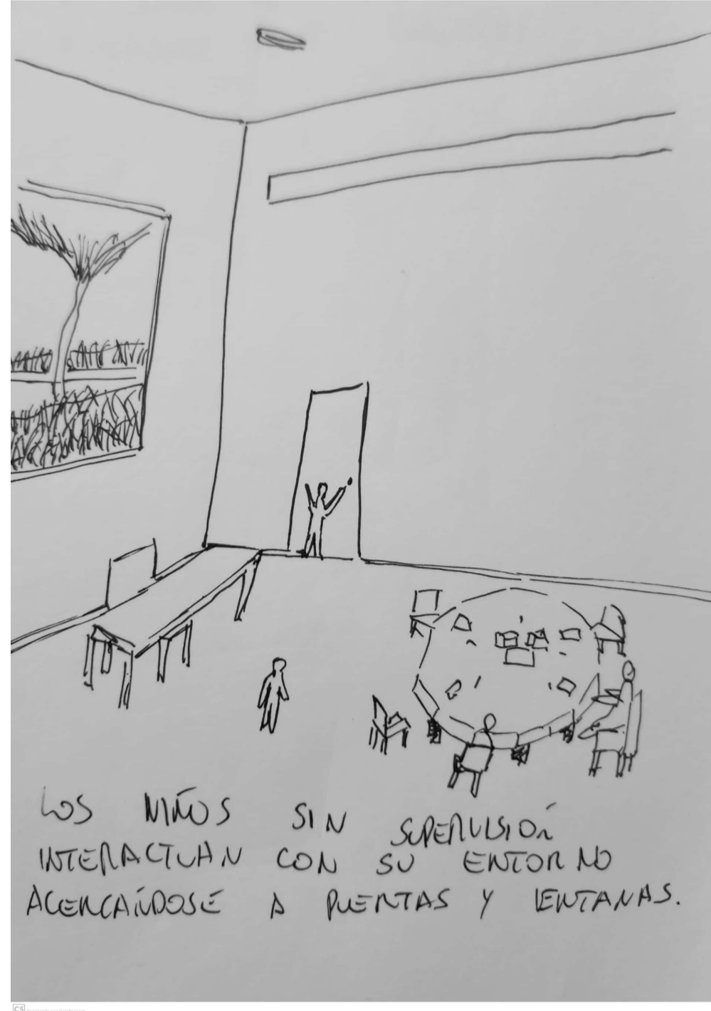
Croquis 5: Interior del aula mirando hacia el exterior.