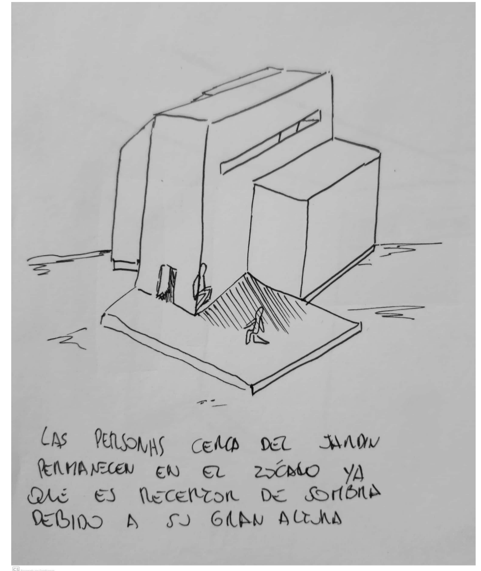
Croquis 2: desde el zócalo hacia el edificio.