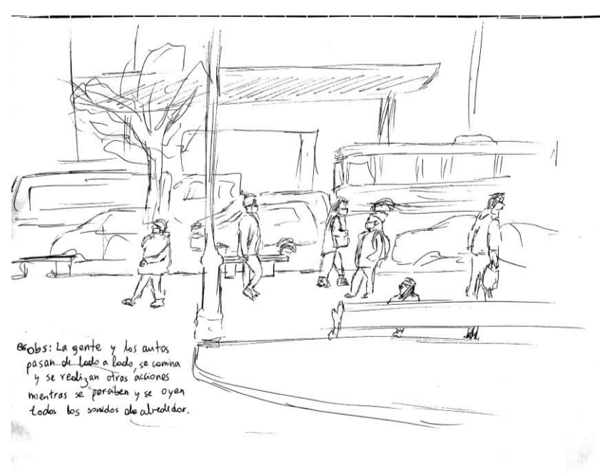
86 Obs: La gente y los autos pasan de lado a lado, se camina y se realizan otras acciones mientras se perciben y se oyen todos los sonidos de alrededor. *El oír constante en la percepción espacial

73: Muchas personas sentadas en una mesa comparten y hablan, se turnan para poner atención a uno o a un par, su vista se centra en los gestos de la persona, en su mirada, en su boca. Bastantes cosas dirigen la atención a las palabras que salen de la persona hablante al oído del oyente. *La atención se dirige a unos sonidos y gestos en específicos