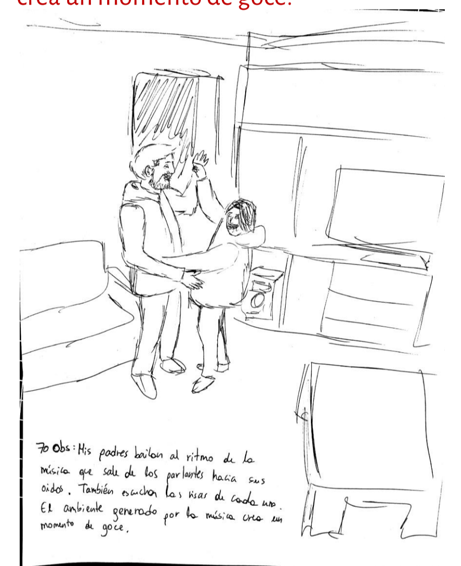
70 Obs: Mis padres bailan al ritmo de la música que sale de los parlantes hacia sus oídos. También escuchan las risas de cada uno. El ambiente generado por la música crea un momento de goce.

En los diferentes espacios en donde las personas habitan, existen distintos sonidos que el oído recoge. Todos estos generan un ambiente sonoro que envuelve a los sujetos que lo perciben. La atención de los individuos se dirige a alguno de estos sonidos, ya sea proveniente del espacio o de otra persona que entabla una conversación. Dentro de la charla entre los individuos se encuentran sonidos, posturas y gestos que mantienen la atención dirigida al dialogo.