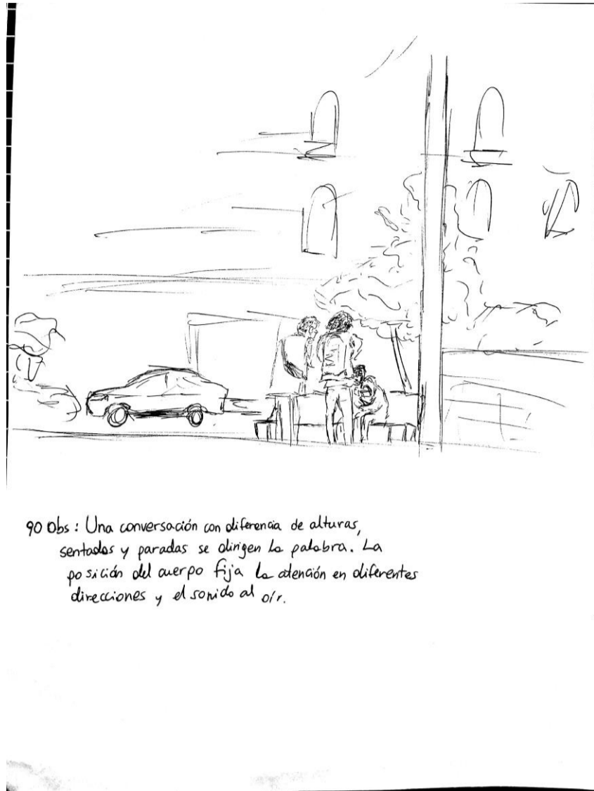
90 Obs: Una conversación con diferencia de alturas, sentados y parados se dirigen la palabra. La posición del cuerpo fija la atención en diferentes direcciones y el sonido al oír.

90: Una conversación con diferencia de alturas , sentados y parados se dirigen la palabra. La posición del cuerpo fija la atención en diferentes direcciones y el sonido al oír.