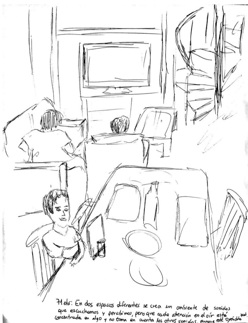
74 Obs: En dos espacios diferentes se crea un ambiente de sonidos que escuchamos y percibimos pero que cada persona en el oír está concentrada en algo y no toma en cuenta los otros sonidos, aunque esté oyéndolos.

71: En dos espacios diferentes se crea un ambiente de sonidos que escuchamos y percibimos , pero que cada atención en el oír está concentrada en algo y no toma en cuenta los otros sonidos, aunque esté oyéndolos igual.