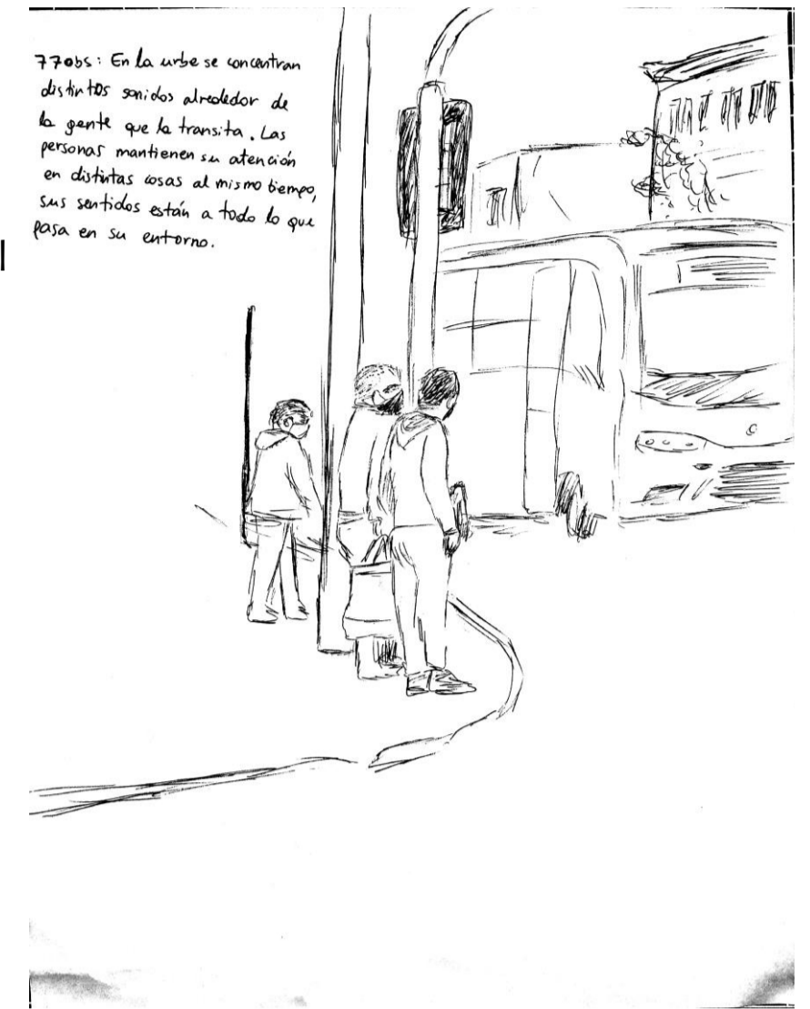
77 Obs: En la urbe se concentran distintos sonidos alrededor de la gente que la transita. Las personas mantienen su atención en distintas cosas al mismo tiempo, sus sentidos están atentos a todo lo que pasa en su entorno.

90: Una conversación con diferencia de alturas , sentados y parados se dirigen la palabra. La posición del cuerpo fija la atención en diferentes direcciones y el sonido al oír.