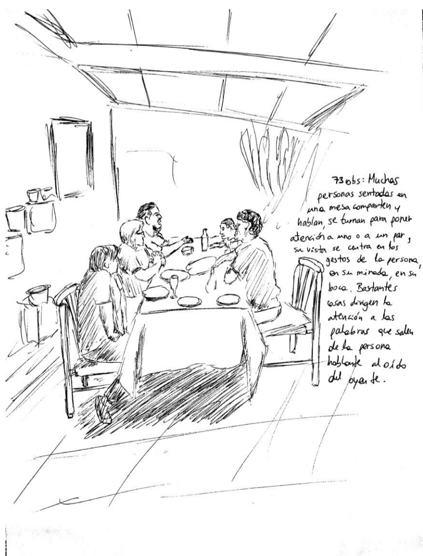
73 Obs: Muchas personas sentadas en una mesa comparten y hablan. Se turnan para poner atención a uno o a un par, su vista se centra en los gestos de la persona, en su mirada, en su boca. Bastantes cosas dirigen la atención a las palabras que salen de la persona hablante al oído del oyente.

*Sonido envolvente, gestos y movimientos que acompañan el oír