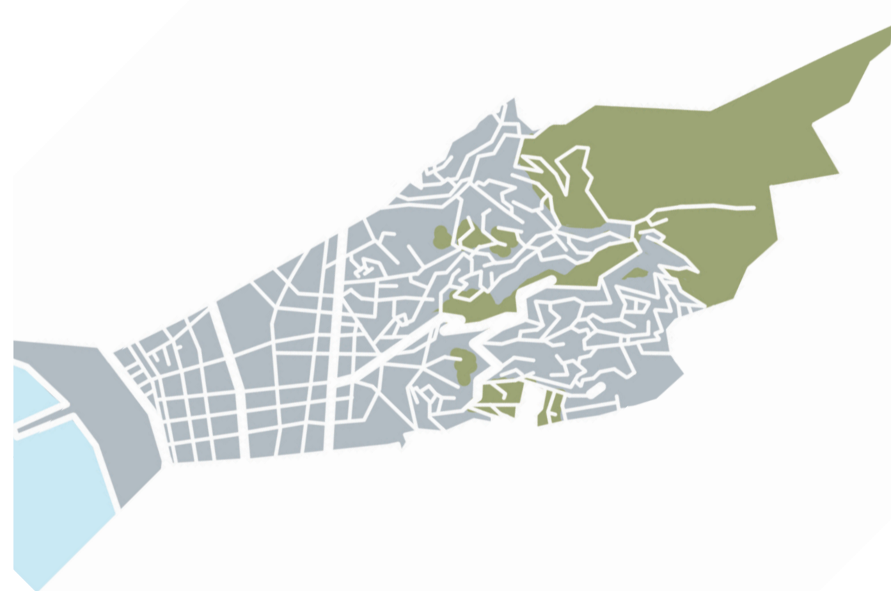
NATURALEZA VS URBANIZACIÓN