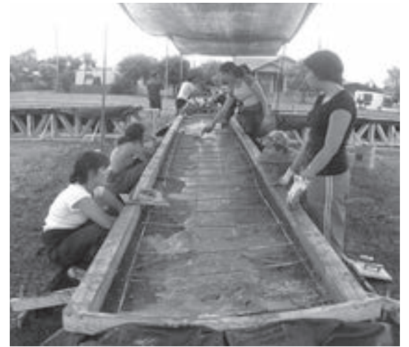
Obra en travesía: mesas en una Plaza en São Miguel das Missoes, Brasil, 2006. Travesía work: tables in the Plaza of São Miguel das Missoes, Brazil, 2006