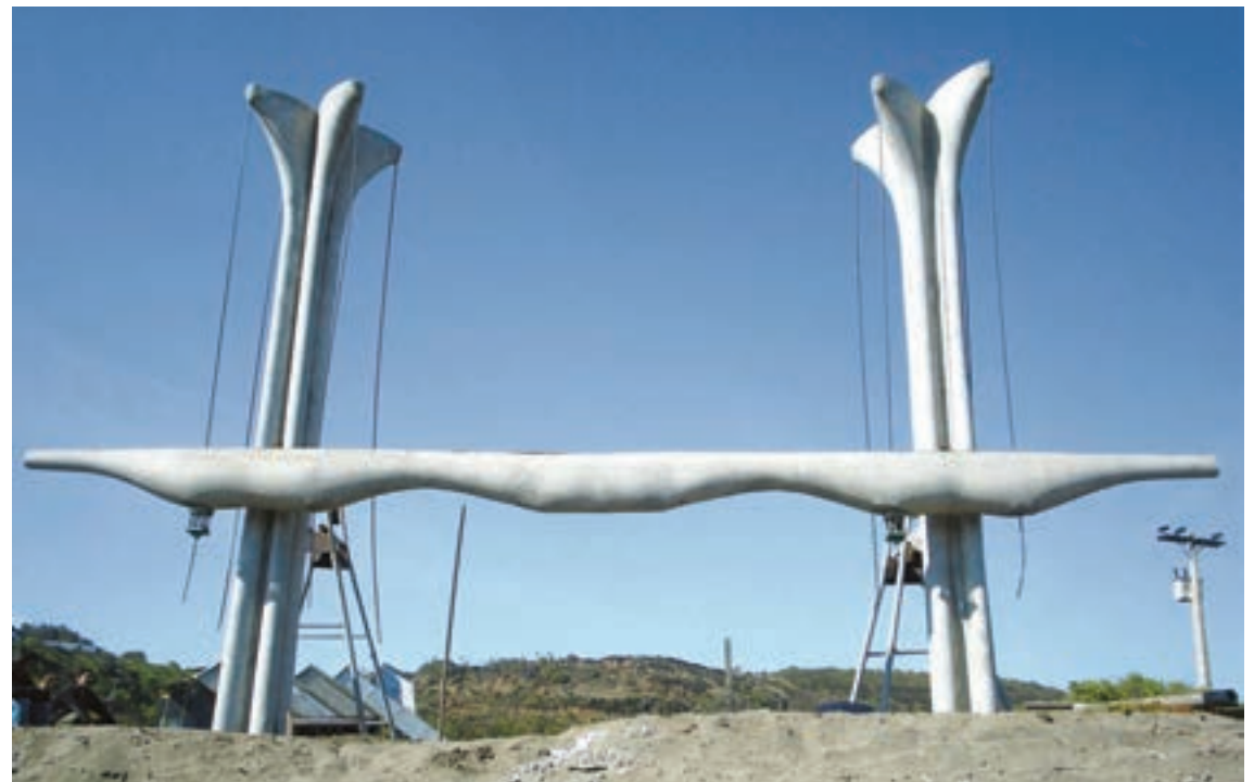
Montaje de pórtico en Ciudad Abierta, Ritoque, 2005 Portico mounting in Ciudad Abierta, Ritoque, 2005