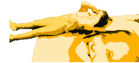
Sacaron sus fotografías en el camión, gigantografías recortadas, para realizar un collage en las fachadas de este lugar a medio levantar

En un lugar de pirou plage, existe un pueblo a medio construir, y medio abandonado. No es ninguna de estas por sí sola, pero es una mezcla de ambas. En el lugar crean un momento de reunión entre los habitantes del lugar y alrededores cercanos, todos en conjunto para realizar esta obra al aire libre.