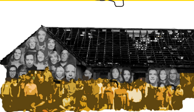
COLLAGE ABANDONADO Se decide construir un collage en las paredes de este pueblo a medio construir.