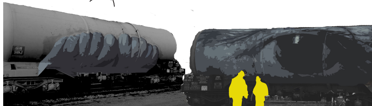
HOMENAJE A AGNÈS RJ decide capturar los ojos y pies de Agnès para que en el tren puedan recorrer mucho más de lo que ella podrá