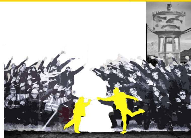
EQUIPO EN LA PARED Deciden trabajar en esta fabrica donde plantean dejar estampado al equipo de personas que son parte de esta comunidad, reuniendo a todos los cargos en dos fotografías que crean una.