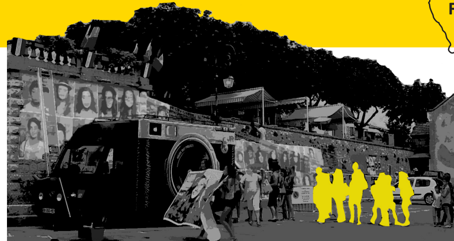
ROSTROS A CIELO ABIERTO Se hace un momento de fotografía a aquellas personas que caminaban por el lugar para realizar un gran collage en la pared.