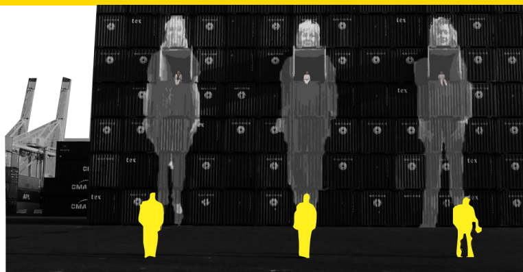
TOTEMS DE LAS ESPOSAS Se crean estatuas enormes en los containers del puerto de las mujeres entrando al mundo de los hombres.