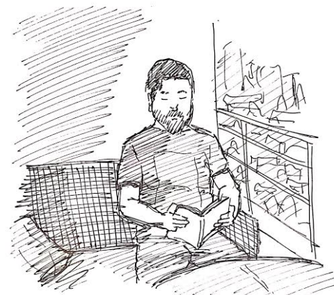
“Esta esquina iluminada por el sol resulta la más indicada en esta tarea, donde el libro logra recibir suficiente claridad para hacer más fácil la lectura. Siendo un poco más tarde, también, el calor no resulta muy exhaustivo y se conforma un equilibrio entre comodidad y utilidad.”

“Encontrándose la casa un poco más fría a la hora en la que comienza a esconderse el sol. Apenas es un cuadrado de sol y luminosidad el que se encuentra en una esquina de la habitación principal. Por lo mismo, son aprovechados los últimos rastros de calor en cada una de las tareas pequeñas que requieren de un breve reposo, como el simple acto de ocupar el teléfono.”