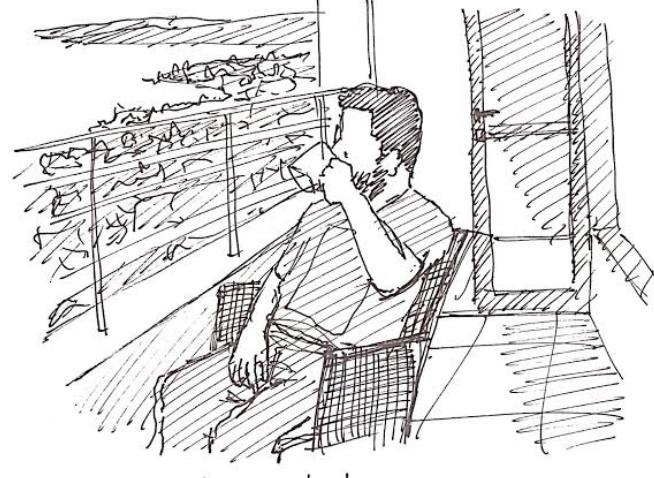
“Cayendo la hora de la tarde, el calor que otorga la luminosidad disminuye en cuanto a intensidad y puede ser aprovechado de una manera más prolongada al dejar de resultar hostigoso como ocurría anteriormente. Por esto, a la hora de realizar actividades que pausan al quehacer del día, se busca este calor tenue que acompaña al reposo, como el de este caso en particular, donde se bebe una taza de té.”