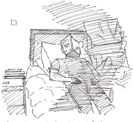
“Durante el reposo, el sol es utilizado de tal forma que logra llegar a gran parte del cuerpo, calentándolo y acentuando el relaxo que conlleva la naturaleza de este tipo de habitar. Sin embargo, al resultar hostigoso después de un rato, especialmente en zonas más delicadas como puede serlo el rostro, el libro es utilizado más de una manera de protección contra este calor que un objeto que proporciona un tipo de entretenimiento u ocupación.”

La luminosidad, el brillo, los rayos de sol y la penumbra que les acompañan no sólo conforman la naturalidad y composición de una totalidad espacial, sino que, junto a lo mismo, desempeña como una variante que, dependiendo de su posición y su intensidad, invitan a las personas que habitan un espacio a realizar ciertas acciones que cobran realidad cuando se cumple una relación entre esta acción y la disposición que entrega esta luminosidad para cumplirla, logrando de esta manera un conjunto de distintas funcionalidades que un mismo lugar puede ofrecer que van cambiando entre sí a medida que estos factores cambian de lugar y densidad.