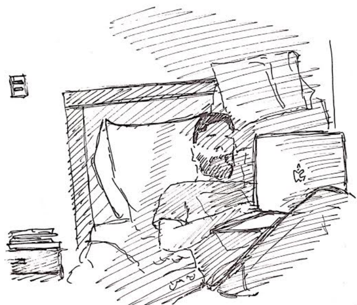
“La forma en la que el cuerpo se coloca ante la luminosidad resulta muy estratégica, al hacer que este brillo en conjunto a las sombras que le acompañan se distribuyen de tal forma que el calor sólo llega a algunas partes del cuerpo y la penumbra envuelve al rostro y a la pantalla del computador para no entorpecer su ocupación con la molestia del reflejo.”

Con la intención de ocupar este dinamismo de utilidad y ocupación que prende de la forma en que las luces y sombras se acuestan sobre cierto espacio, la luz retratada en la estructura busca mimetizar la que puede observarse en el croquis: un brillo que logra dividirse entre los componentes físicos del lugar que ocupa, otorgando un conjunto de sombras con diferentes opacidades y, con ellas, destellos de luz que desempeñan diferentes papeles y posiciones. De esta forma, las acciones que se disponen crecen en posibilidad y dejan de limitarse al tiempo que puede tomarle conformarse cierta luz o sombra correspondiente al acto.