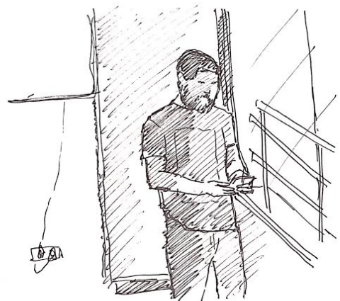
“Encontrándose la casa un poco más fría a la hora en la que comienza a esconderse el sol. Apenas es un cuadrado de sol y luminosidad el que se encuentra en una esquina de la habitación principal. Por lo mismo, son aprovechados los últimos rastros de calor en cada una de las tareas pequeñas que requieren de un breve reposo, como el simple acto de ocupar el teléfono.”