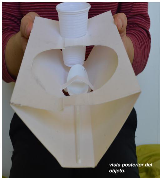
vista posterior del objeto.

Gesto: el gesto que se quiere hacer aparecer a través del objeto, se vuelca en las cualidades de San Francisco, destacando la humildad. De esta manera, cuando los participantes del acto se acercan a la olla, construirán la humildad y recogimiento propios de la persona franciscana.