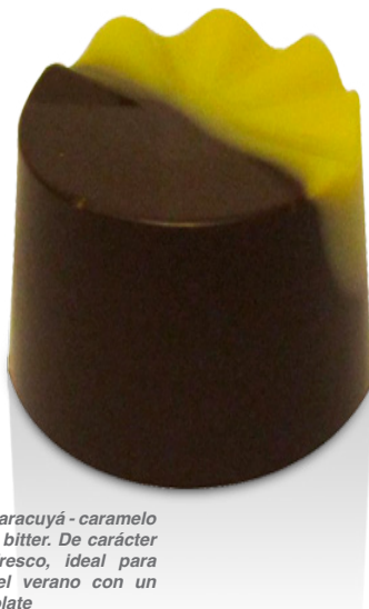
Maracuyá crema de maracuyá - caramelo - chocolate bitter. De carácter cítrico y fresco, ideal para disfrutar del verano con un buen chocolate

Dado que se está en calidad de logro, como punto de partida se dejan claro las dimensiones de un bombón. O bien, algo delicioso que se come en 2 bocados para 4