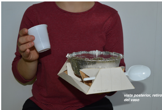
vista posterior, retiro del vaso