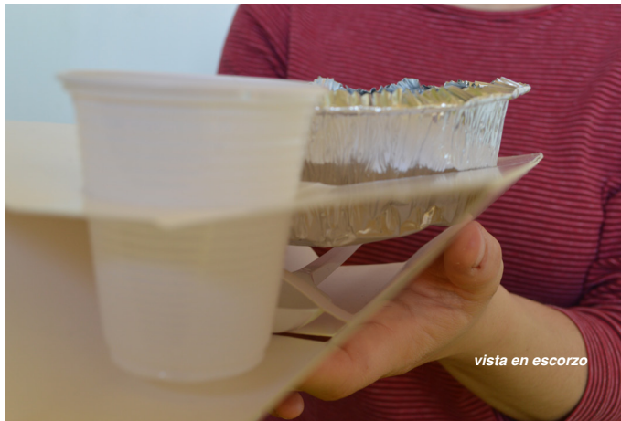
vista en escorzo