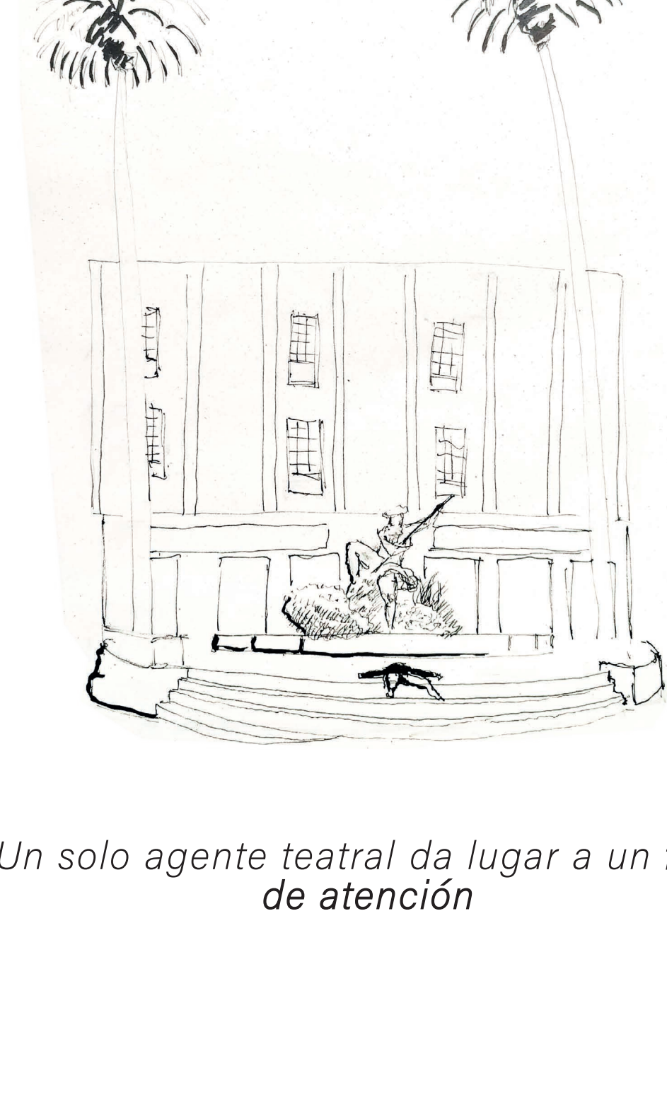
Un solo agente teatral da lugar a un foco de atención