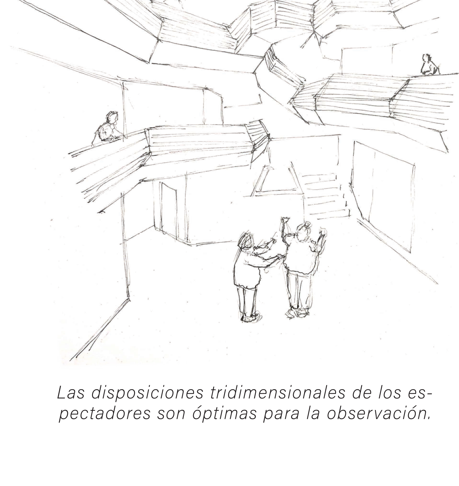
Las disposiciones tridimensionales de los espectadores son óptimas para la observación .