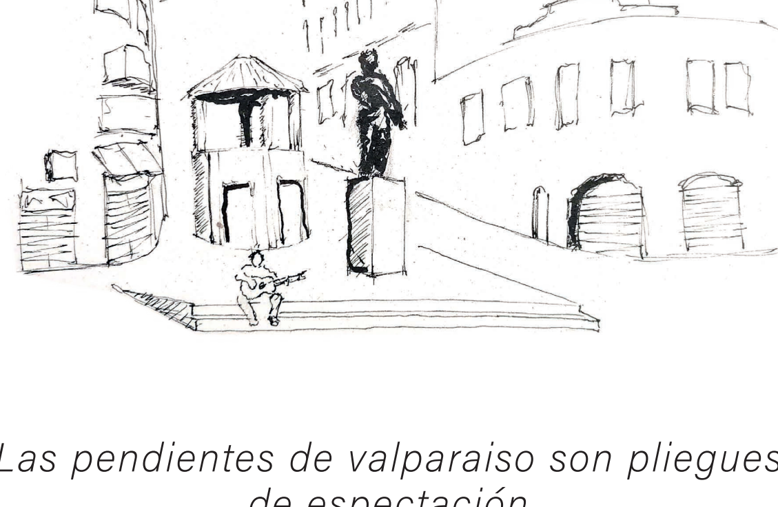
Las pendientes de Valparaíso son pliegues de espectáculo