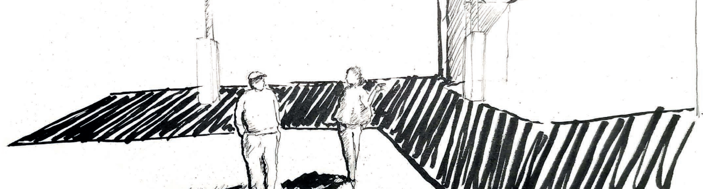
En el diálogo lo que era un punto se convierte en una tensión entre dos focos que origina un eje virtual

Las configuraciones geométricas anteriores que resultan de la cantidad de focos de atención se definieron en un marco bidimensional, que no representa la complejidad de la realidad.