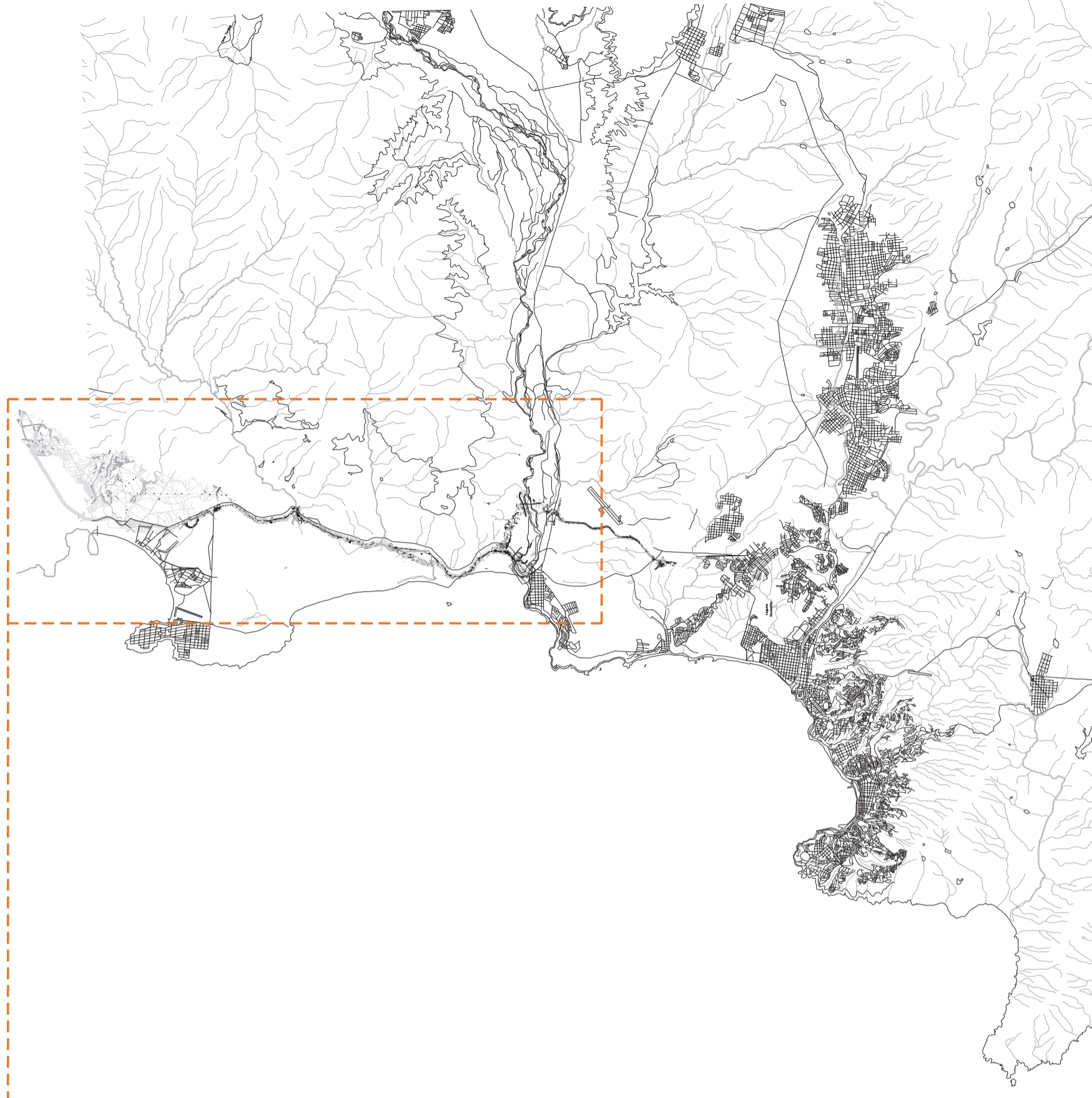
Plano del Gran Valparaiso, discimiendo zonas urbanas, hidrografia y sistema viario