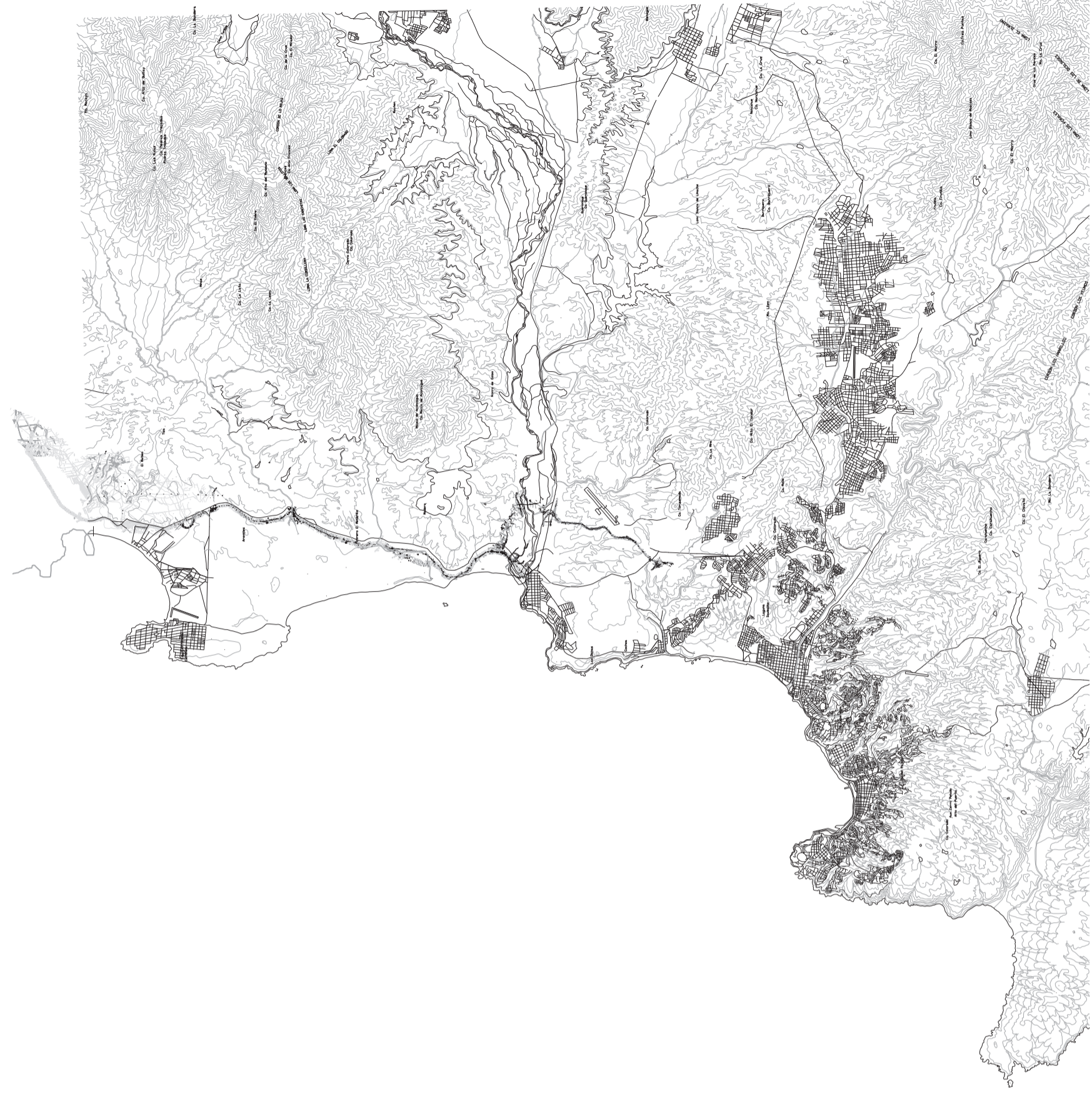
Plano del Gran Valparaiso, discimiendo zonas urbanas, topografia y toponimia