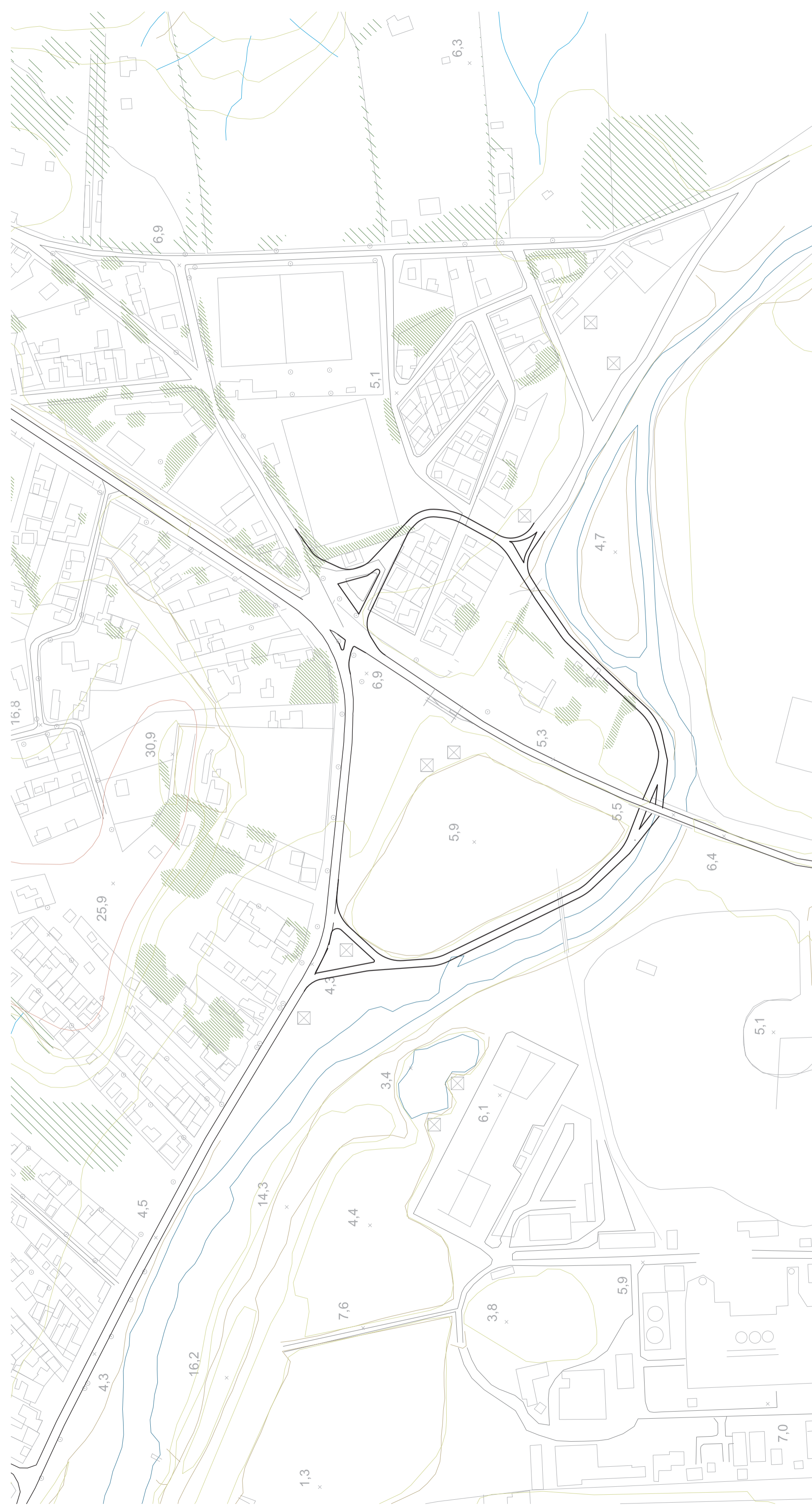
Plano del cruce a Ventanas. propuesta "megaronda" 1:2500