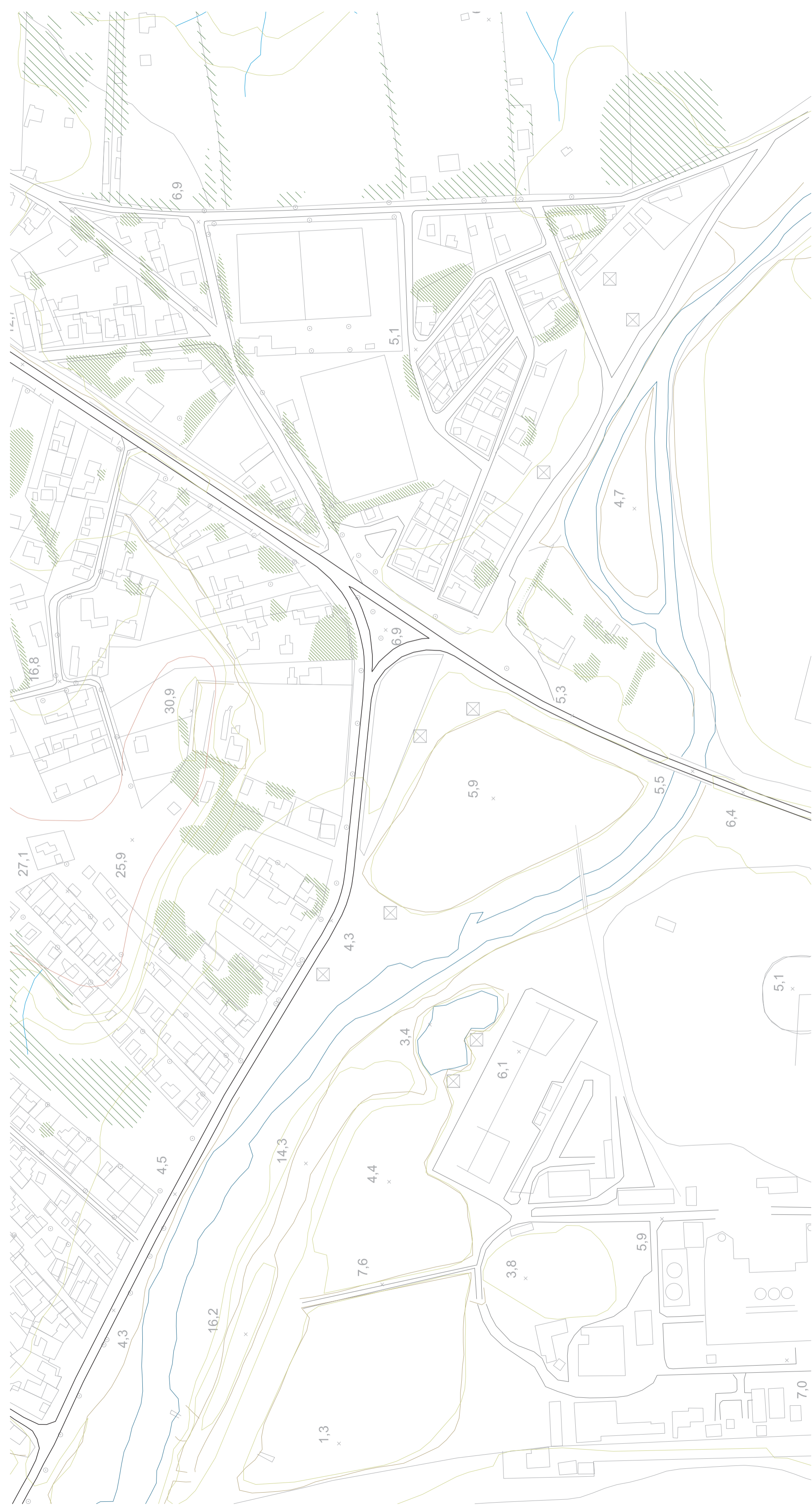
Plano del cruce a Ventanas. estado actual 1:2500