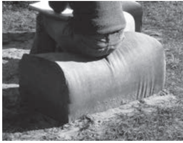
Jardín en Garupá, Argentina, 2003. Garden in Garupá, Argentina, 2003