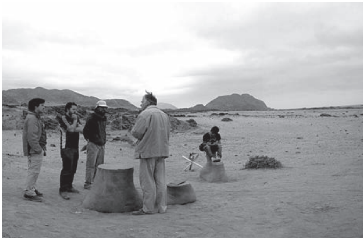
Obra en travesía, Parque Nacional Pan de Azúcar, Chile, 2009. Travesía work, Pan de Azúcar National Park, Chile, 2009