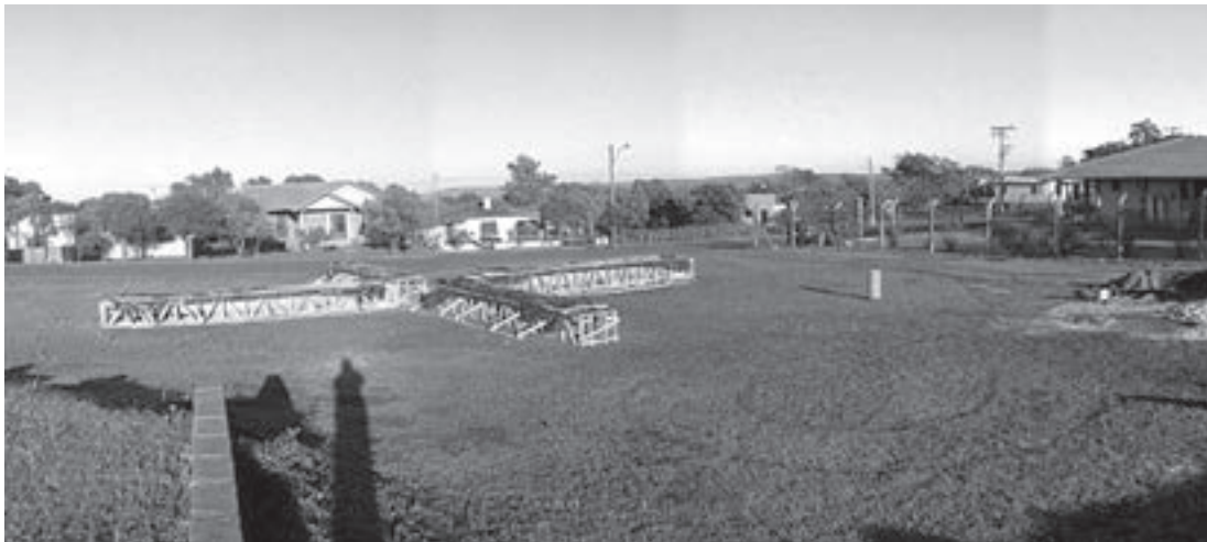
Obra en travesía: mesas en una Plaza en São Miguel das Missoes, Brasil, 2006. Travesía work: tables in the Plaza of São Miguel das Missoes, Brazil, 2006