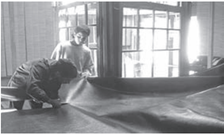
Corte de patrón en geotextil para encofrado de mesas en São Miguel das Missoes. Pattern cut in geotextile for table framework in São Miguel das Missoes