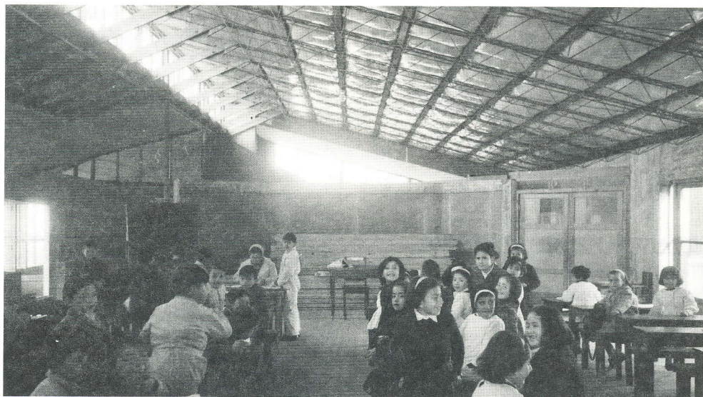
Fig 2: Comedores en la Escuela María Gaete de Arauco.