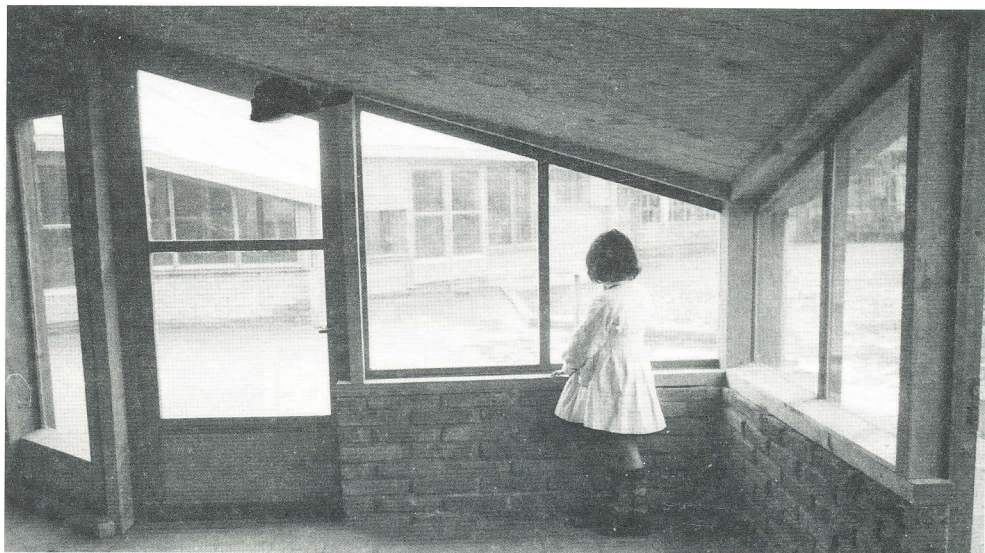
Fig 3: Un rincón en el Colegio María Gaete de Arauco.

vida se esta mirando permanentemente". Esta transparencia, se compensaba por una disposición poco predecible de los espacios, que la distancian de la concepción panóptica. Por último, el cuidado de las texturas materiales, especialmente en pavimentos y cielos, vinculaba a unos y otros espacios.