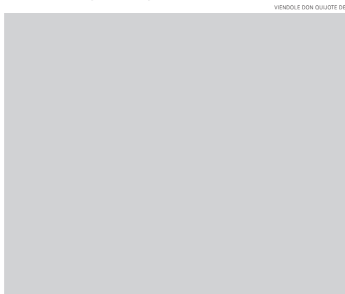
VIENDOLE DON QUIJOTE DE

Y, viéndole don Quijote de aquella manera, con muestras de tanta tristeza, le dijo: Sábete, Sancho, que no es un hombre más que otro si no hace más que otro. Todas estas borrascas que nos suceden son señales de que presto ha de serenar el tiempo y han de sucedernos bien las cosas; porque no es posible que el mal ni el bien sean durables, y de aquí se sigue que, habiendo durado mucho el mal, el bien está ya cerca. Así que, no debes congojarte por las desgracias que a mí me suceden, pues a ti no te cabe parte dellas. Y, viéndole don Quijote de Sábete, Sancho, que no es un hombre más que otro si no hace más que otro. Todas estas borrascas que nos suceden son señales de que presto ha de serenar el tiempo y han de sucedernos bien las cosas; porque no es posible que el mal ni el bien sean durables, y de aquí se sigue que, habiendo durado mucho el mal, el bien está ya cerca. Así que, no debes congojarte por las desgracias