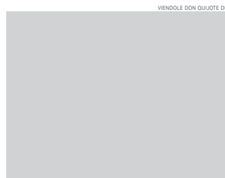
VIENDOLE DON QUIJOTE DE

hombre más que otro si no hace más que otro. Todas estas borrascas que nos suceden son señales de que presto ha de serenar el tiempo y han de sucedernos bien las cosas; porque no es posible que el mal ni el bien sean durables, y de aquí se sigue que, habiendo durado mucho el mal, el bien