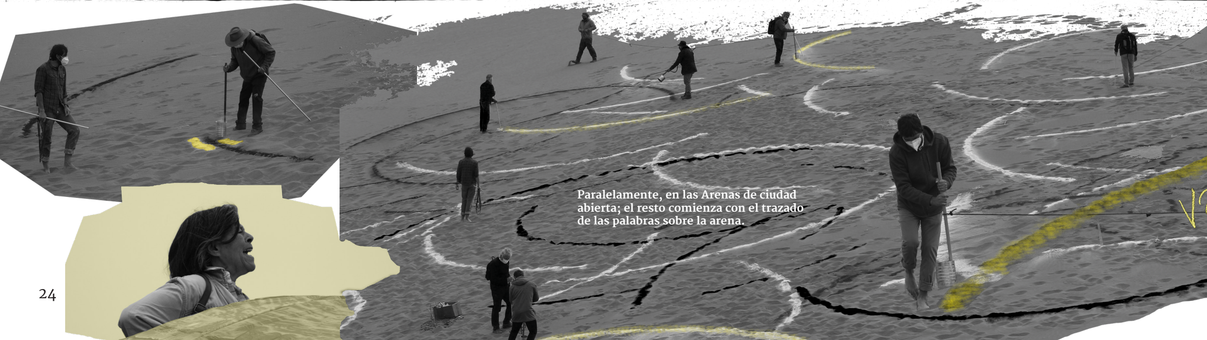
Paralelamente, en las Arenas de ciudad abierta; el resto comienza con el trazado de las palabras sobre la arena.