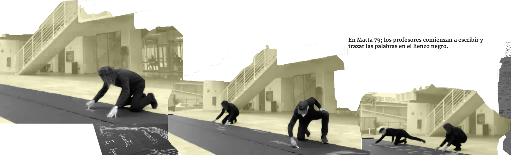
En Matta 79; los profesores comienzan a escribir y trazar las palabras en el lienzo negro.