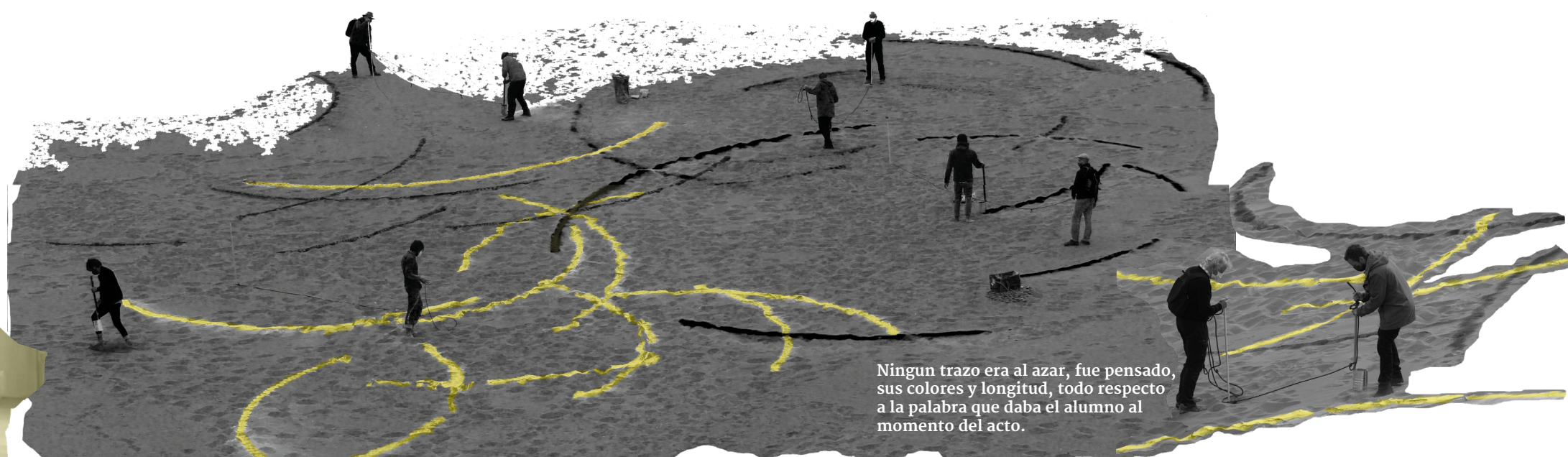
Ningun trazo era al azar, fue pensado, sus colores y longitud, todo respecto a la palabra que daba el alumno al momento del acto.