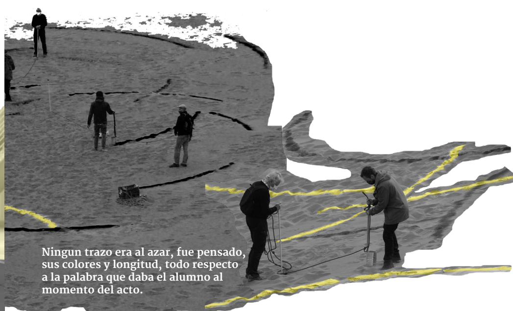
Ningun trazo era al azar, fue pensado, sus colores y longitud, todo respecto a la palabra que daba el alumno al momento del acto.