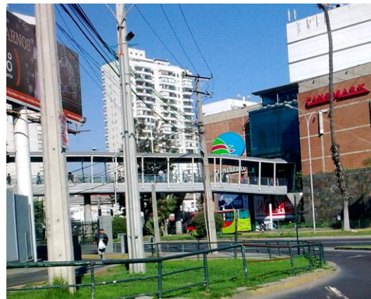
Pasarela peatonal del Mall Marina Arauco, Viña del Mar, Chile

proliferación respondía a la psicosis de la sociedad contemporánea por la seguridad. Pasarelas y túneles que conectaban hoteles con estaciones de tren, torres de edificios con centros comerciales, etc., extendían los sistemas de control utilizados en lo privado hacia lo público, lo cual le permitía a los "ciudadanos de bien" moverse sin necesidad de pisar sus calles y plazas, es decir, sin necesidad de entrar en contacto con la pobreza, la delincuencia, la marginalidad, etc. Lo mismo ocurrió con los centros comerciales, convirtiéndose en los nuevos espacios públicos de la vida urbana 18 . Lo mismo ocurre en otra escala en nuestro país en varias ciudades, al ver los denominados Malls, que conectan edificios, centros comerciales y generan una red de lugares como espacio público cerrado.