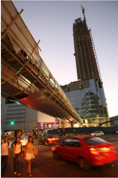
Pasarela Mall Costanera Center, Santiago de Chile

la ciudad se fragmenta a sí misma, en puntos fijos, cerrados y "seguros".