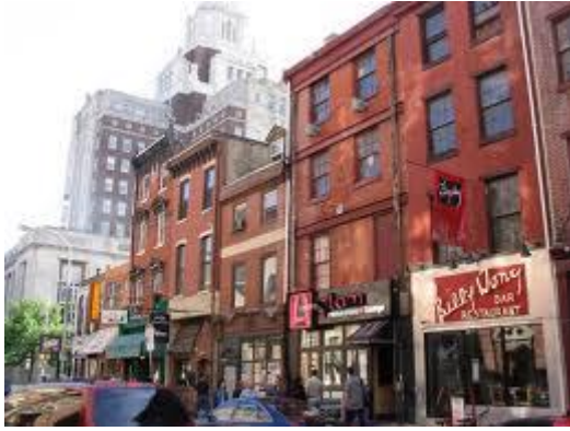
Old City, centro urbano de Philadelphia

Esto permitió crear un negocio potencial para la empresa privada en cuanto a la rehabilitación de los cascos históricos. Los centros urbanos empezaron a renacer, viéndose renovadas y fascinantes, ofreciendo una mejor calidad de vida que los lejanos suburbios de buen nivel. Entonces la clase media vio posible su retorno a esta zona. En estos casos en particular, aquellos que tomaron la decisión fueron los yuppies 10 , jóvenes profesionales que trabajaban en distritos financieros cercanos. Este hecho produjo un crecimiento comercial en los centros urbanos, convirtiéndolos en espacios residenciales de lujo, inaccesibles para la clase obrera, quienes muchos como antiguos residentes, se vieron sustituidos por esta nueva generación de jóvenes adinerados. Este proceso de expulsión de la población originaria y suplantación por otra de mayor poder adquisitivo se ha denominado como gentrificación 11 . Esto viene promovido por los sectores público (La Administración se encarga de ordenar las calles, reparar las infraestructuras y de ofrecer ayuda para la rehabilitación de