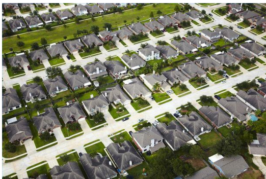
Home Owners Associations de Estados Unidos

declarasen community 14 para así poder autogestionarse. De esta manera, surgieron las "comunidades cerradas", enclaves de servicios y espacios públicos destinados exclusivamente a sus residentes, es lo que nosotros conocemos acá en Chile como "condominios". Mike Davis 15 las denomina "archipiélagos carcelarios", o sea una transformación del espacio urbano en una sucesión de islas fortificadas, en un territorio fragmentado en infinidad de enclaves amurallados 16 . Ésta es la manera en que la vida privada en aquellas zonas de Estados Unidos ha tomado desde el miedo y el enfrentamiento entre clases sociales, la forma de tener que abastecerse de fortificaciones para su resguardo, seguridad y control.