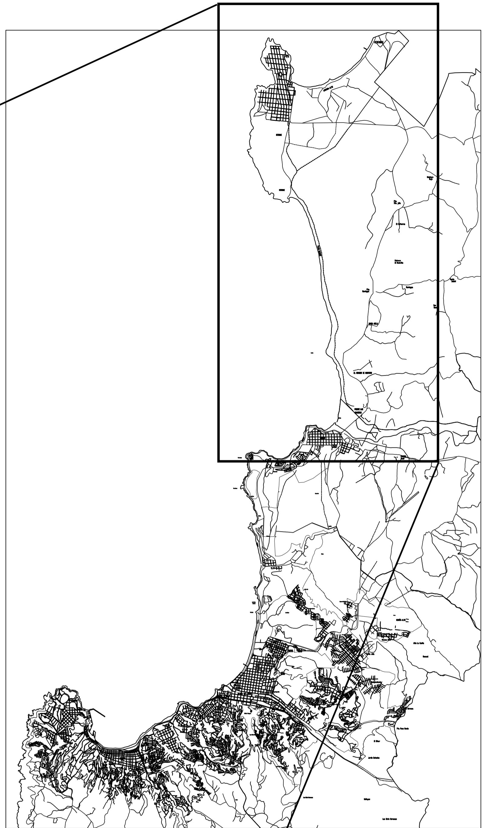
b. PLANO UBICACIÓN 25 KMS ESTUDIO ELEMENTO URBANO RUTA F30e Escala 1:5000