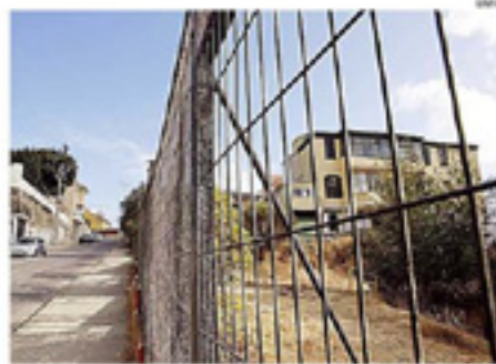
JUNTA VECINAL DEL CERRO ALEGRE DIO UN REUNIÓN CON CONCEJALES.

"Impactará en la calidad de vida de más de 1.500 familias y cerca de 2.000 estudiantes. Un proyecto de esta envergadura debería haber sido sometido a una Evaluación de Impacto Ambiental que demuestre que no significará un deterioro en la vida de nadie", recibe la aclaración pública entregada por la organización. CS