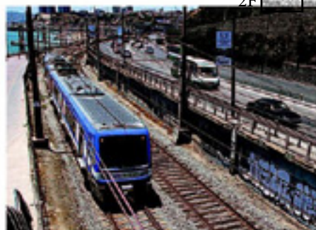
METRO VALPARAÍSO HA SUFRIDO TRES FALLAS EN LOS ÚLTIMOS MESES. 1F

En más de una ocasión volvieron a incendiar el cuerpo para reducir sus restos al máximo, y lo que quedó lo echaron en bolsas de basura y los enterraron para asegurarse de que ningún perro dejara al descubierto el crimen. La pareja mantuvo la mentira por casi un año.