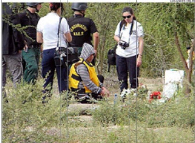
DURANTE LA INVESTIGACIÓN LOS ACUSADOS HICIERON UNA RECONSTRUCCIÓN DE LOS HECHOS.