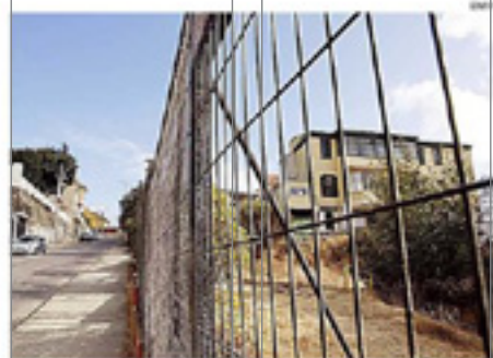
JUNTA VECINAL DEL CERRO ALEGRE ENVIÓ REQUERIMIENTO A CONCEJALIALES.

"Impactará en la calidad de vida de más de 1.500 familias y cerca de 2.000 estudiantes. Un proyecto de esta envergadura debieron haber sido sometido a una Evaluación de Impacto Ambiental que demuestre que no significará un deterioro en la vida de nadie", remata la aclaración pública entregada por la organización. CE