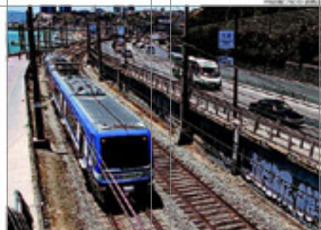
METRO VALPARAÍSO HA SUFRIDO TRES FALLAS EN LOS ÚLTIMOS MESES.

En más de una ocasión volvieron a incendiar el cuerpo para reducir sus restos al máximo, y lo que quedó lo echaron en bolsas de basura y los empujaron para asegurarse de que ningún perro dejara al descubierto el crimen. La pareja mantuvo la mentira por casi un año.