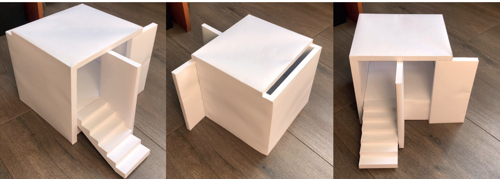
Fotografías recreación maqueta sacristía | escala 1:25