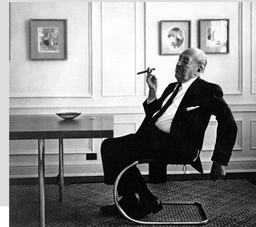
Ludwig Mies van der Rohe fue un arquitecto y diseñador industrial. Dirigió la escuela Bauhaus entre 1930 y 1933, año en que fue cerrada.