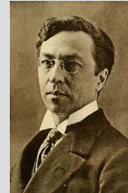
Wassily Kandinsky, pintor ruso, precursor de la abstracción en pintura y teórico del arte

Paul Klee, pintor alemán nacido en Suiza Wassily Kandinsky, pintor ruso.