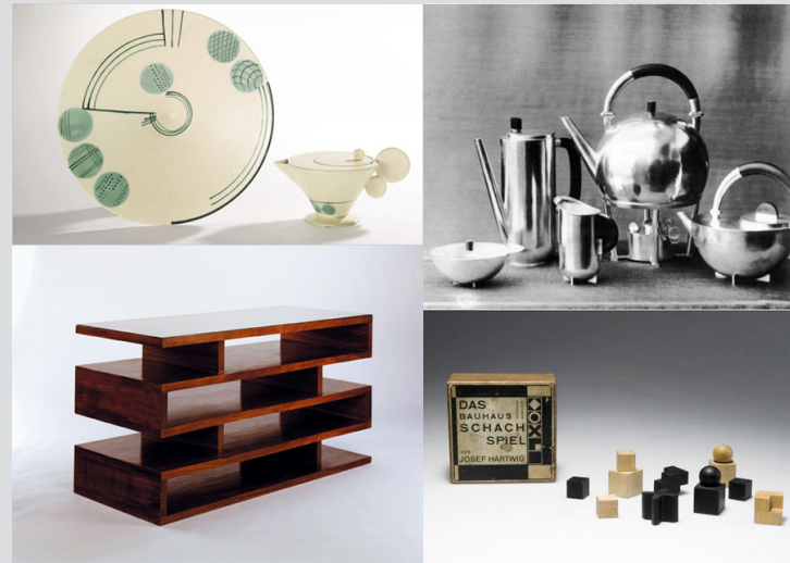
Obras creadas en los diversos talleres de la escuela Bauhaus

Dado esto los talleres se convirtieron en talleres productivos, dando el espacio a los estudiantes ya formados generar ingresos propios y que aportaran conocimiento y ayuda a la escuela.