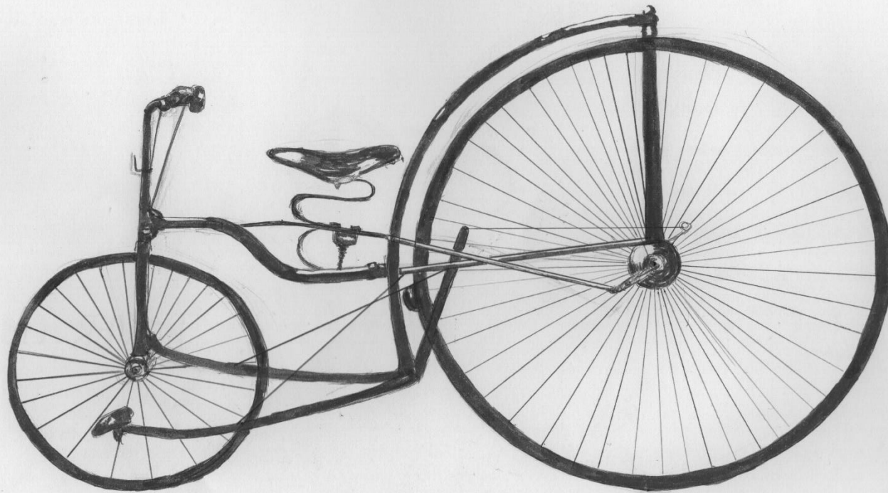
Modelo Safety de Lawson (1870).