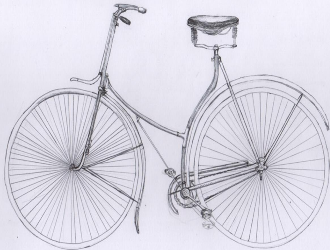
Modelo Rover (1885-1886)