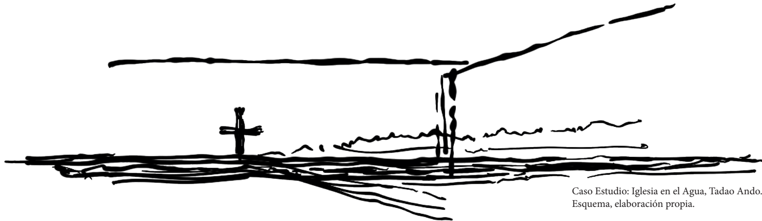
Caso Estudio: Iglesia en el Agua, Tadao Ando. Esquema, elaboración propia.

Extender el habitar del interior al paisaje, da cuenta de la sensibilidad y valoración del emplazamiento de la obra, la convergencia de ambos elementos plantean una continuidad visual.