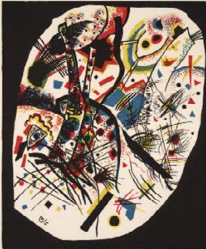
Small Worlds III (Kleine Welten III) de Small Worlds (Kleine Welten)

Nombre de la Obra: Pequeños mundos (Kleine Welten) (1922)