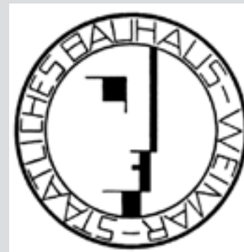
Logo de la Bauhaus en Weimar

Sin el vacío social y político creado por la crisis nacional entre la Revolución alemana de 1918/19, la disolución de la monarquía y de la ratificación de la Constitución de Weimar el 11 de abril de 1919, la base de este tipo de institución con tales objetivos de largo alcance habría sido inconcebible. Con el establecimiento de la Bauhaus, Walter Gropius, en última instancia nada menos que educar y formar a un nuevo tipo de diseñador y ser humano, que contribuiría a cambiar el mundo pretendía.