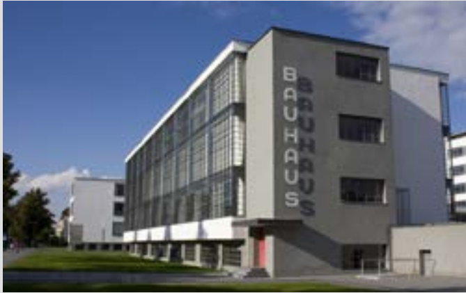
Edificio de la Bauhaus en Dessau (1915)

La idea subyacente de la Bauhaus, fue la creación de una nueva unidad de la artesanía, el arte y la tecnología. La intención era ofrecer el entorno adecuado para la realización de la Gesamtkunstwerk (obra de arte total). Con este fin, los artistas prometedores fueron a enseñar en una escuela con una orientación interdisciplinaria e internacional.