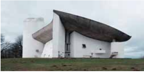
Iglesia Notre Dame (Francia, 1950-1955)

Arquitecto, teórico y artista que revolucionó la forma en concebir una edificación con la premisa de que la arquitectura era capaz de cambiar al mundo . La arquitectura debía ser una herramienta para mejorar la calidad de vida de las personas y sus ideas han influenciado en la construcción de numerosas ciudades modernas. El arquitecto suizo-francés nos dejó un gran regalo, y es aquel legado de que la ciudad debe ser diseñada para satisfacer las necesidades de sus habitantes y que la arquitectura es una herramienta para mejorar la calidad de vida de las personas.