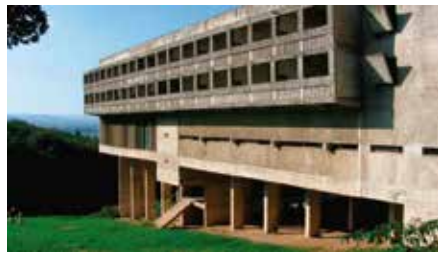
Convento de la Tourette (Francia, 1953)