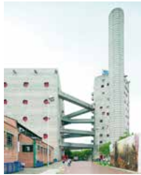
SESC Pompéia, 1977-1986