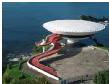
Museo de arte contemporáneo de Niterói

Nació en 1907 en el barrio de ladera de Río de Janeiro, Brasil, y estudió en la Academia de Bellas Artes de allí. La Arquitectura de Niemeyer, fue concebida como una escultura lírica, expandida en los principios y las innovaciones de Le Corbusier para convertirse en una especie de escultura de forma libre .