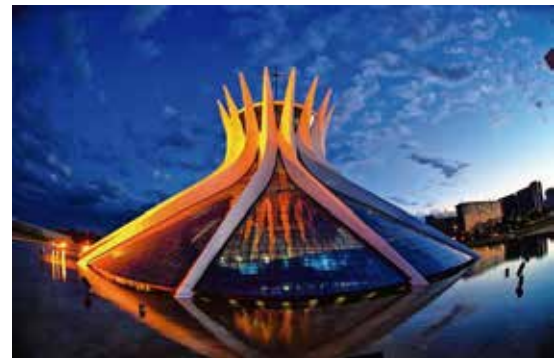
Catedral de Brasilia