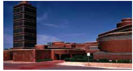
Sede de la Johnson Wax