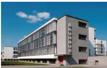
Escuela de la BauHouse

Destacado arquitecto alemán y fundador de la Escuela de la Bauhaus en 1919. Como uno de los primeros arquitectos en integrar la tecnología y la industria en su diseño, Gropius creía en la importancia de la innovación en la arquitectura. Su regalo para la vida diaria de la ciudad fue la creación de edificios eficientes y funcionales que abrazaban la estética moderna y sencilla al mismo tiempo que mejoraban la calidad de vida de sus habitantes.