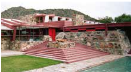
Escuela de arquitectura ,Taliesin West

Considerado uno de los padres del Movimiento Moderno en arquitectura y uno de los arquitectos más importante del siglo XX, destacó por su enfoque innovador y su filosofía de una arquitectura orgánica en armonía con la naturaleza .Propone una arquitectura que se integra a la naturaleza y que utiliza técnicas de construcción sostenibles