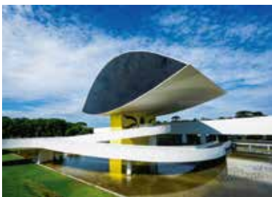
Museo Oscar Niemeyer