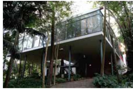
Casa de Vidrio, 1950-1951