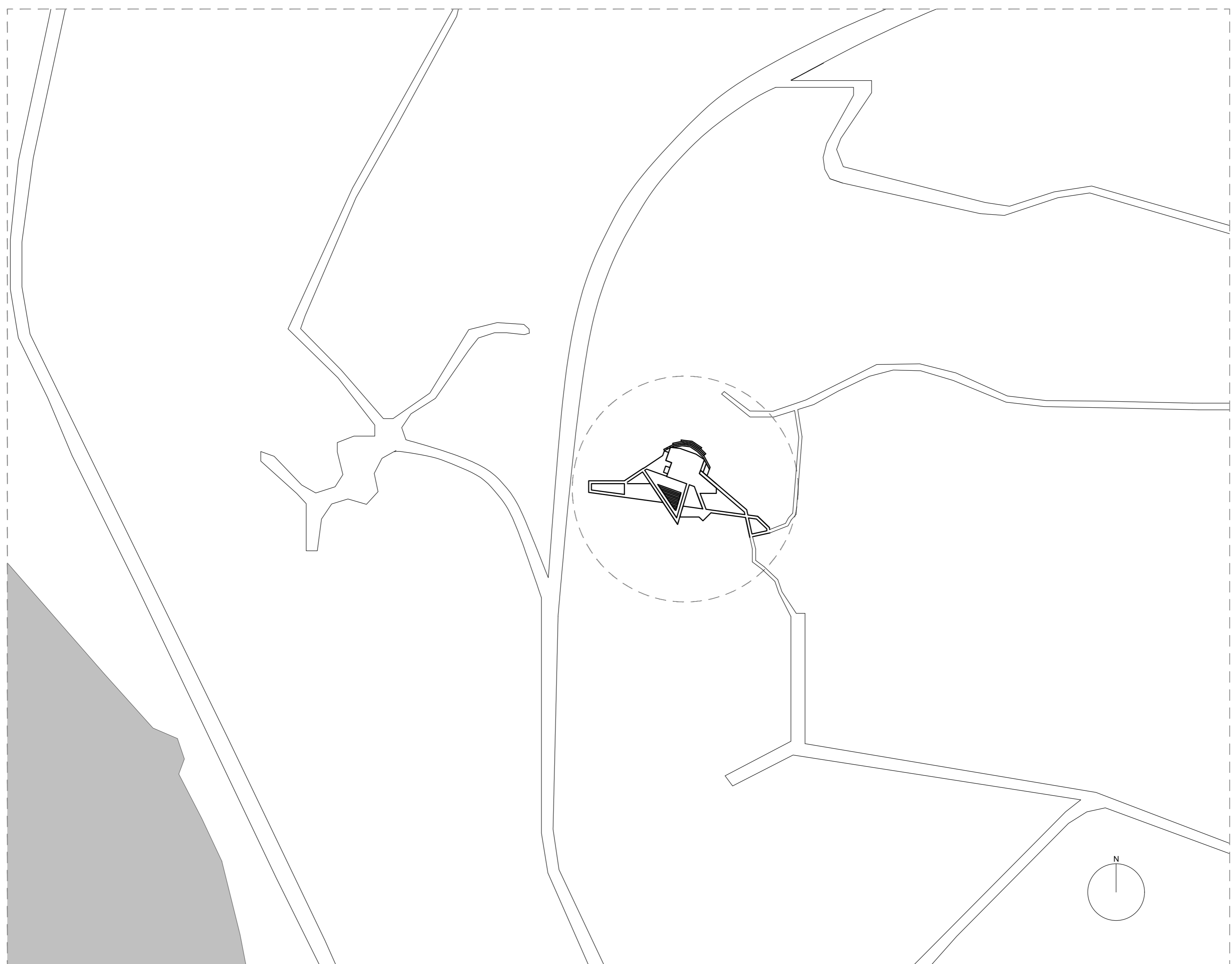
PLANO DE UBICACIÓN ESCALA 1:2000