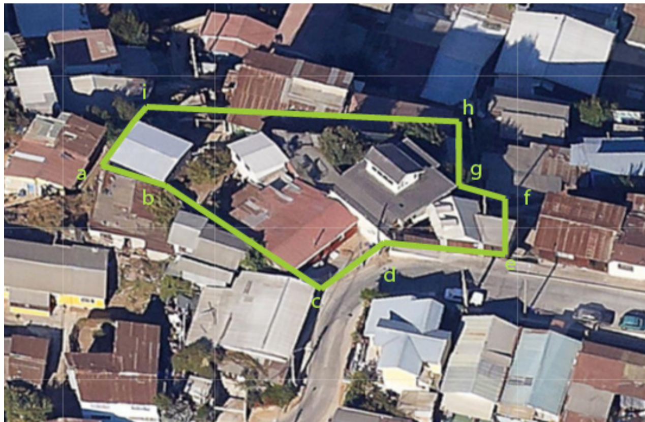
Polígono perímetro del predio: a-b-c-d-e-f-g-h-i-a