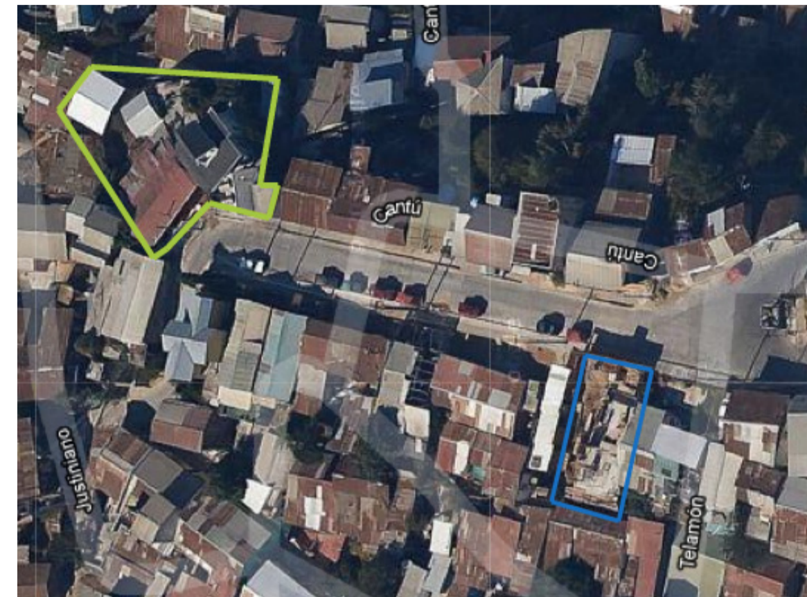
Predio centro social deportivo Predio de reubicación

En ninguno de estos casos, la casa es declarada patrimonio, ni vive un personaje emblemático para la comunidad. Por lo tanto, debido a lo anterior, el plan a realizar para poder llevar a cabo el proyecto allí es trasladar a aquellas familias a la misma calle Cantú en un terreno a la altura de Telamón, en el cual se estaba llevando a cabo una obra que consistía en un parvulario para el sector, sin embargo, la construcción quedó a medias y no se finalizó por quiebra de la empresa. Así no se estaría perjudicando la vida de quienes habitan en ellas ni el ritmo o dinámica de barrio.