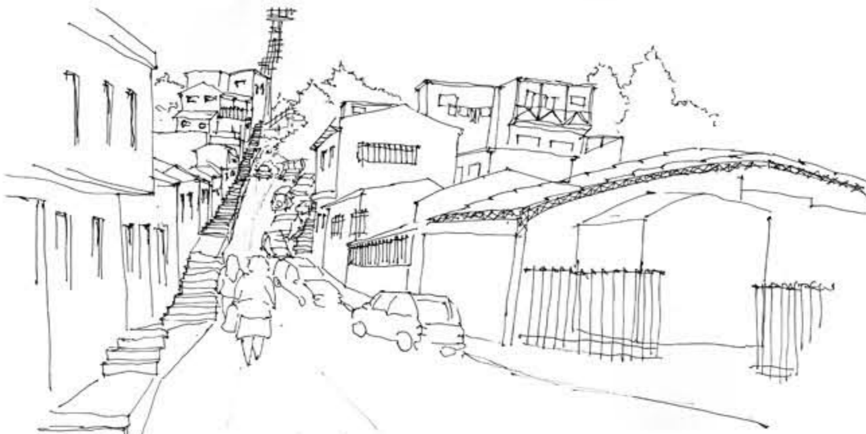
Lugar donde se comprende la unificación visual del barrio que aminora las distancias cima pie de cerro. Se crea una unidad espacial desde lo sensorial