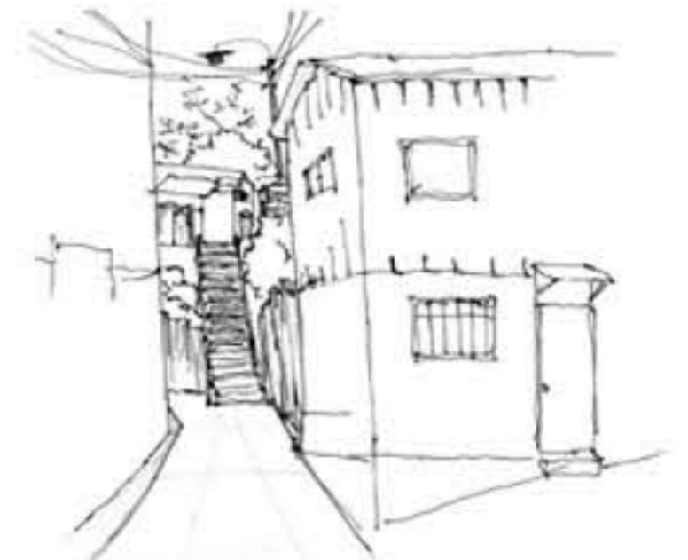
El modo de adosamiento de las casas a la ladera es una consecuencia del trazado urbano que delimita los recorridos. Deslinda los predios.