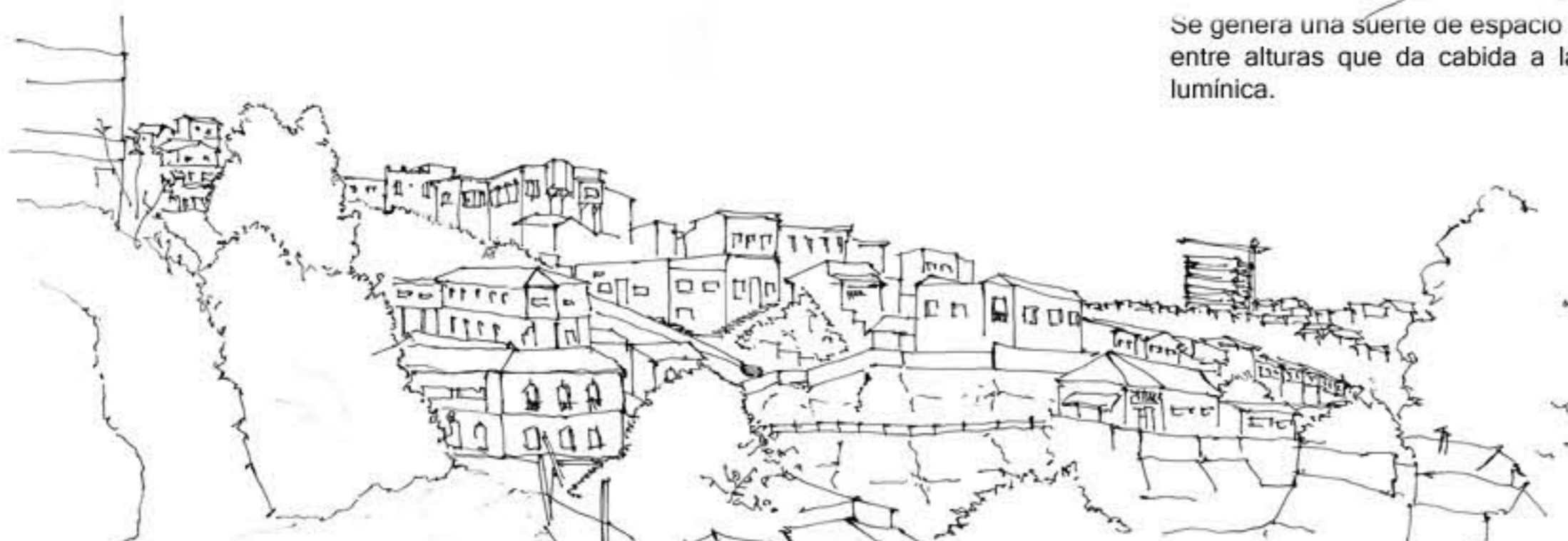
Existe cierta intencionalidad de retiro, el asentamiento a modo distanciado del ritmo de ciudad, mas relacionado visualmente. Se apremia la espacialidad como una entrada lumínica, una suerte de distención en el conglomerado de ciudad ( quebradas que rompen con la densidad del un tejido urbano, lo vuelven mas permeable a las condiciones climáticas del lugar)