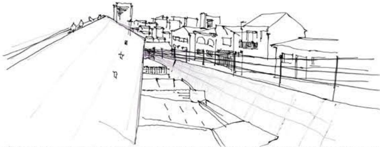
Existen varios tipos de asentamientos de quebrada, uno es formando parte de esta ( hundido) y otra es posándose sobre esta. El primero se hace cargo de la realidad geográfica de lugar, existe un diálogo entre habitante y el lugar en su estado natural.