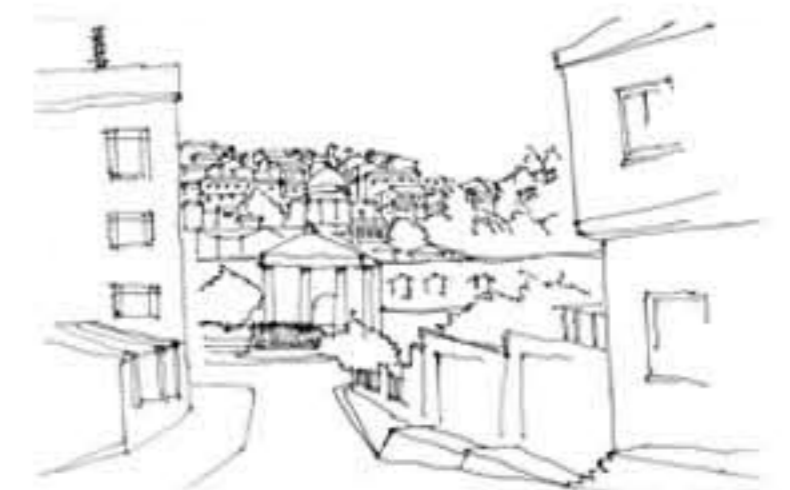
Relación visual inmediata cima pie de cerro. Al llegar al pasaje, es como llegar a la cima. Se crea un contacto visual que inmersa al barrio

Las cuencas, se presentan como una suerte de heridas geo-urbana que otorgan un gran regalo al habitar de ciudad. Brindan de una mayor calidad lumínica espacial a las casas. Es una suerte de herida en donde la ciudad descansa, un claro donde se distiende el conglomerado urbano, para dar paso a una mayor espacialidad (física y visual) y una mayor incidencia lumínica ( si es bien emplazada la construcción). Se genera así un retiro físico de la ciudad y una complicidad visual entre barrios con un carácter vestal, con dominio del lugar.