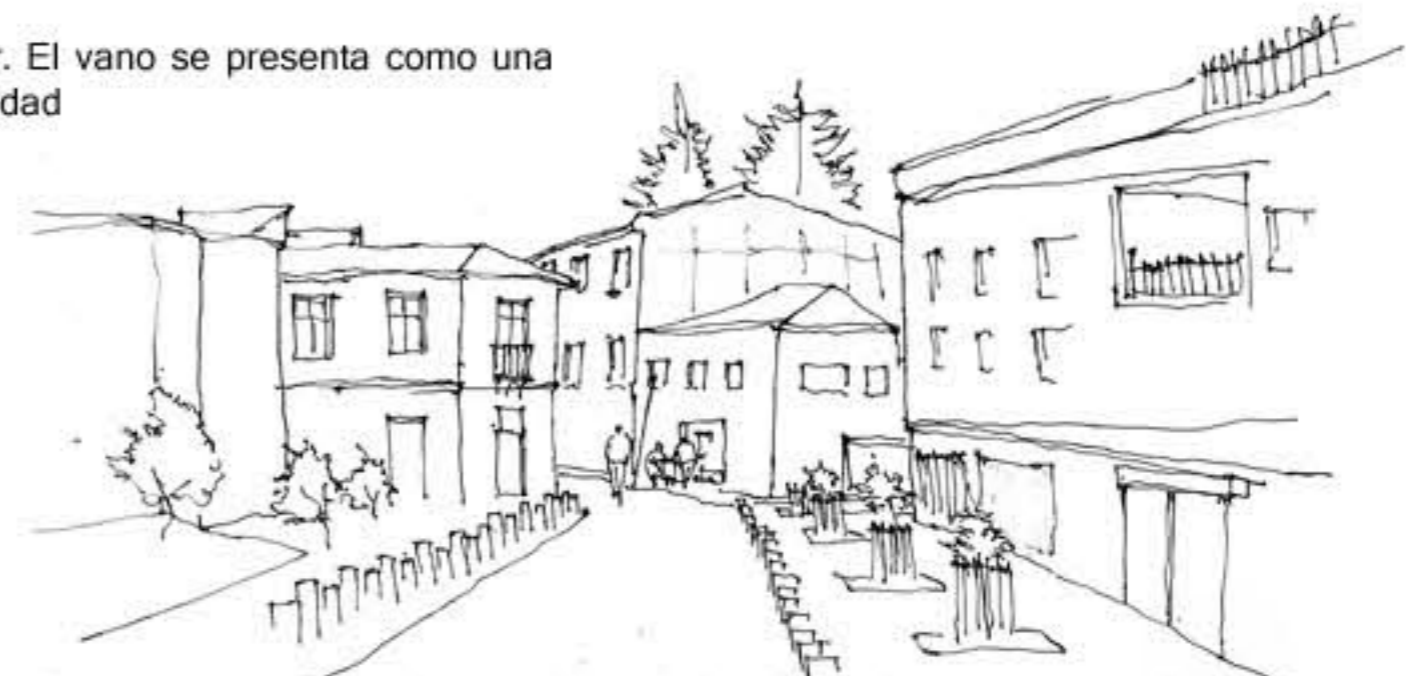
Se genera una suerte de espacio para el enrirentamiento, una suerte de vano exti r entre alturas que da cabida a la distención espacial, por tanto, a la distención lumínica.