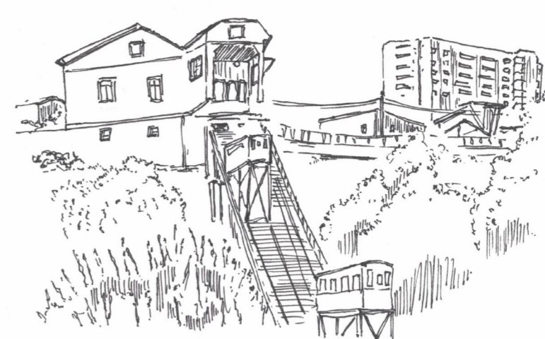
QUE OCURRE CON LA PENDIENTE DE LA ASCENSOR Y LA CASA ? LA ASCENSOR Y SU PENDIENTE PERTENECE A LA CASA Y ES MÁS, LA LATERALIDAD DE LA CASA EN LAS BARANDAS DE LA CALLE ACTUAN COMO BALCÓN QUE DA UNA VINCULACIÓN A UNA FORMA TOTAL ENTRE LOS ELEMENTOS COMPUESTOS POR ASCENSOR-CASA-BALCÓN.

La distribución de un espacio como lo es un establecimiento educacional (desde este proyecto), está focalizado en el desarrollar del cuerpo infantil. Que el centro sea el desenvolver del juego. Porque a través de este (el juego), el ser corpóreo desarrolla su mente y cuerpo. Es así que la distribución espacial se extiende vastamente por la superficie, de borde a borde, no solo para que el ser corpóreo se desarrolle, sino que se desarrolle junto a sus pares, donde el juego es compartido en todos los extremos de la limitante. Así permisible, nuevamente, en las aberturas visuales hacia el centrar del juego. Donde estas aberturas dan para el avizorar.