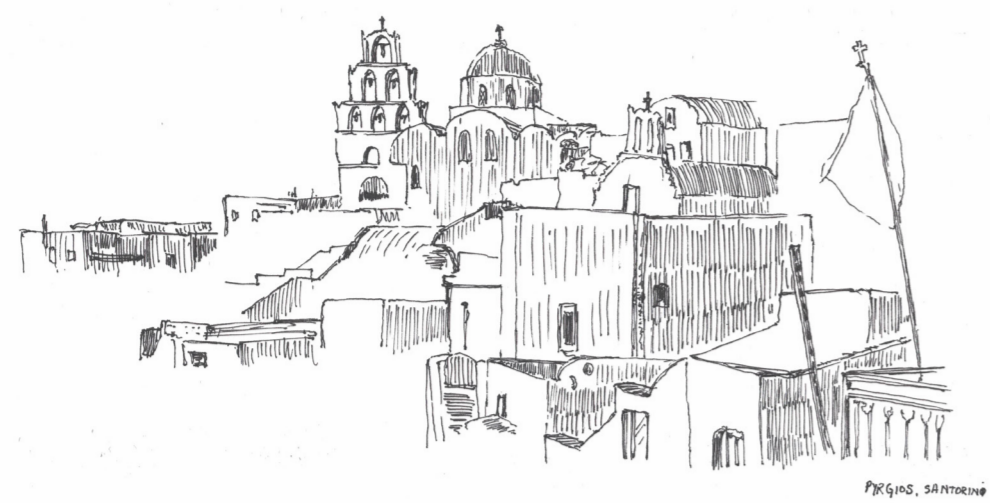
EL ASCENDER DEL CERRO PRESENTA EL TAMAÑO EN LA CULMINE DE LA VERTICAL. UN ZÓCALO CONSTRUÍDO ORGANICAMENTE CON EL SUBIR DEL TERRENO NATURAL DONDE LA IGLESIA EN LA PUNTA SE MUESTRA TOCANDO EL CIELO. -TAMAÑO VERTICAL SOSTENIDA EN EL CERRO CONSTRUÍDO.-