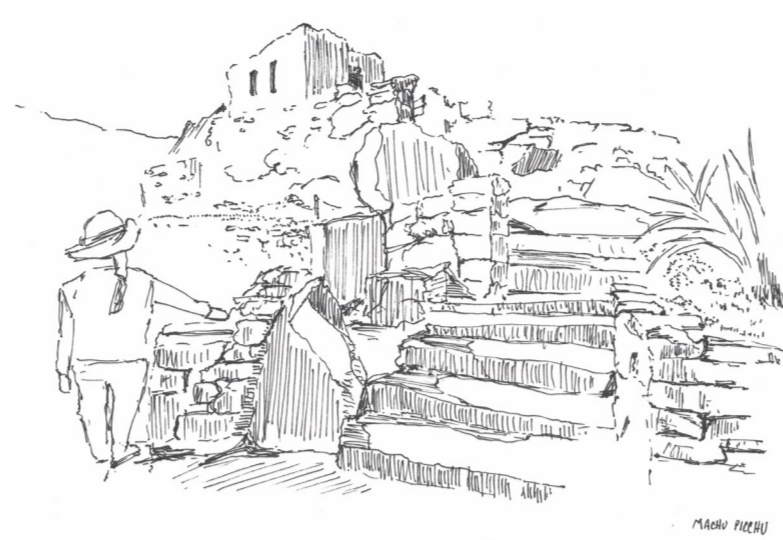
ESCALINATA DINAMICA EN EL PRESENTAR Y DESENVOLVER DEL CUERPO EN SU USO DE ASCENSO Y DESCENSO. ESTE DINAMISMO HACE REFERENCIA AL REDIRECCIONAR DEL CUERPO PARA LLEGAR A LA CIMA. EL SUELO DE LA ESCALINATA NO SE APARTA DE LA ESTRUCTURA SUPERIOR SINO QUE SE VINCULA HACIA ÉL, PRESENTÁNDOLO CON UN TERRENO CONSTRUÍDO.