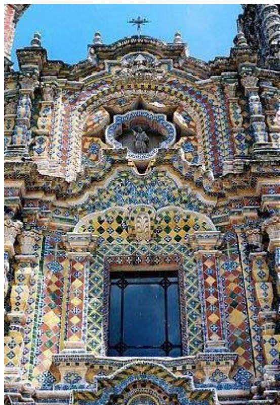
Muestra del estilo poblano de azulejo