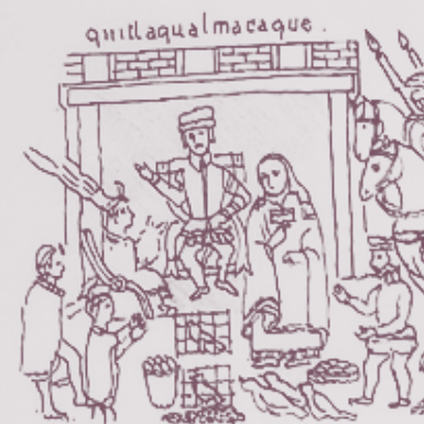
Escena de Texcoco - la fundación superior

III. Conquista de México - Cuzco de Aztlán. (Cuzco, Puebla)