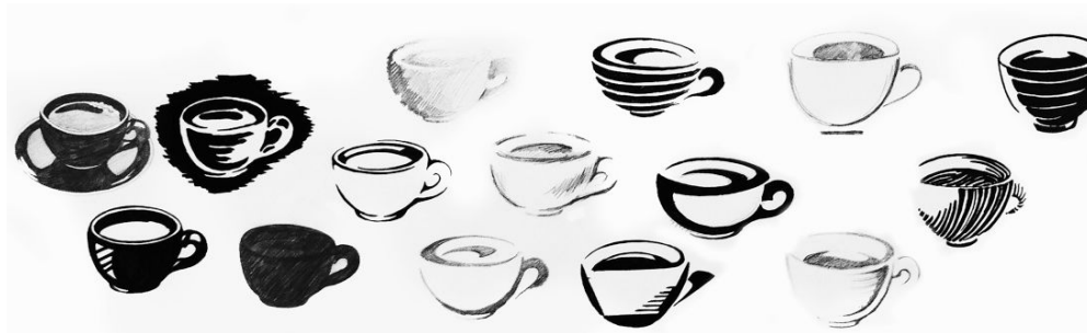
figura 4: Fotografía Ejercicios en Dibujos con diferentes estilos de recursos gráficos. Elaboración propia en base a contexto enseñanza-aprendizaje. CC BY 4.0