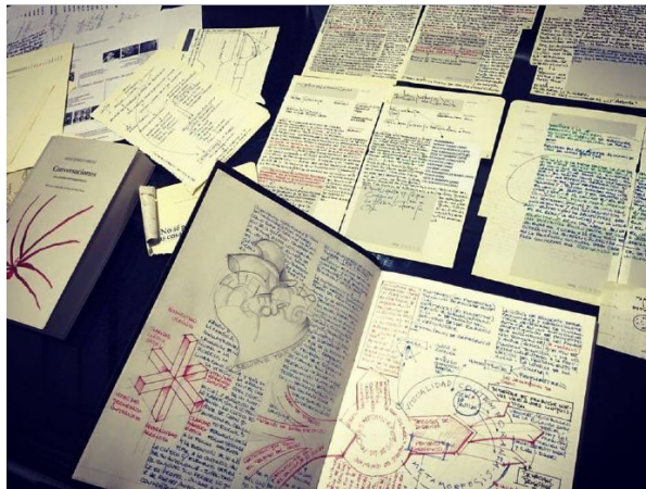
figura 3: Fotografía Bitácoras personales de Cátedras impartidas. Elaboración propia en base a contexto regional. CC BY 4.0

Registro visual de materia de estudio en Cátedras impartidas para estudiantes de Arquitectura, Diseño y Oficios interdisciplinarios