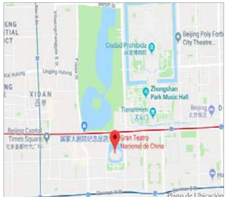
Plano de Ubicación

Superficie total: 150.000 m 2 Superficies segregadas: (por recintos, programa, etc.) Otros: