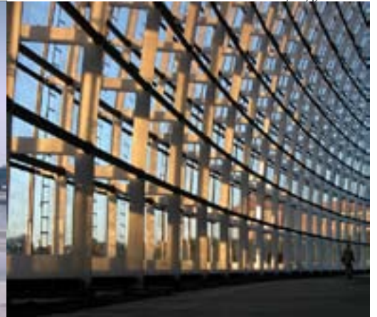
Estructura desde interior