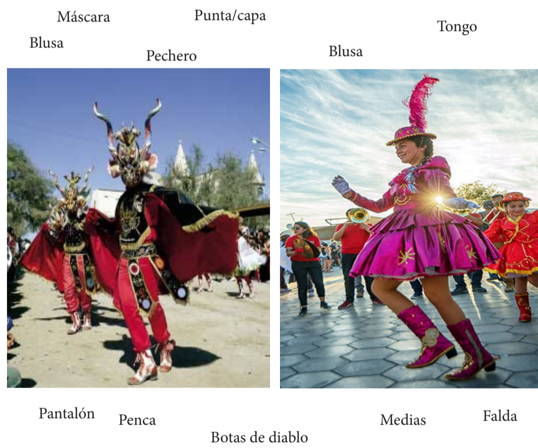
Máscara Punta/capa Tongo Blusa Pechero Blusa Pantalón Penca Botas de diablo Medias Falda

La diablada: Cada conjunto de baile esta compuesto por un grupo de 20 no más de 20 personas. Es dirigido por un lider, quien lleva una mascara que lo identifica