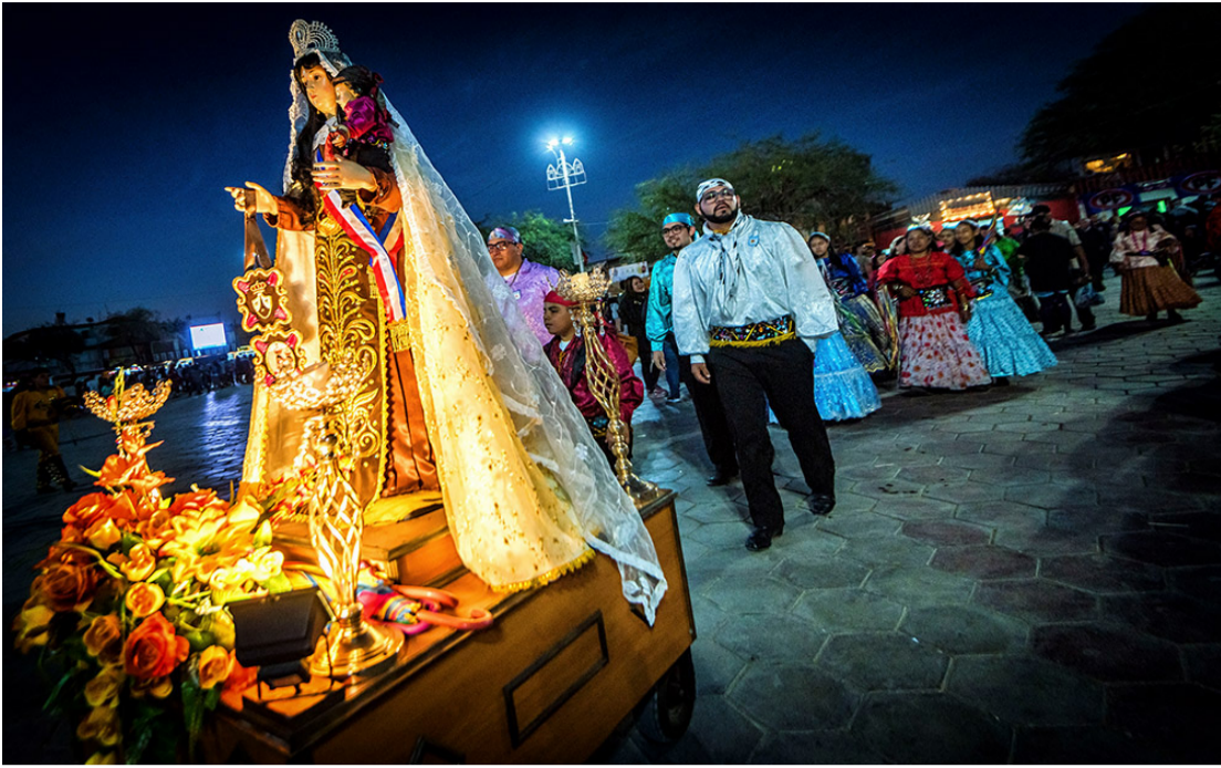
Nombre: Fiesta de la tirana Año: Siglo XIX País: Chile Ciudad: La tirana Ideología: Religiosa Motivo de festejo: Homenaje. Día de celebración: 16 de julio