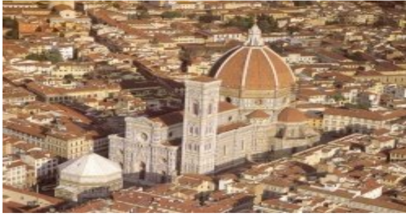
monumentalidad en la ciudad de Florencia.

la utilidad (Utilitas) de la cual habla Marco Vitruvio, logrando la organización social del hombre en el espacio.