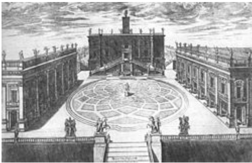
Plaza del Campidoglio. Italia.

Estas reformas interiores de la ciudad fueron potenciando lugares como plazas y lugares abiertos ya que se empezó a tratar de embellecer estos lugares ya existentes como los edificios más monumentales. Entre estas plazas se encuentran la Plaza del Duomo, Plaza de San Marcos, La Gran Plaza de Italia, la Plaza del Campidoglio.