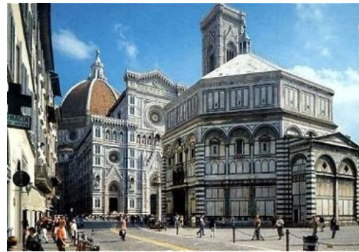
Plaza del Duomo, Florencia, Italia.

Estos espacios abiertos potencian la monumentalidad de las edificaciones a las cuales anteceden, pensados hace cientos de años pero que hasta en la actualidad podemos observar alrededor del congreso nacional en Valparaíso, el palacio de la Moneda en Santiago de Chile o la CN Tower en Canadá.