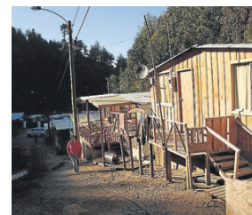
▶ Según el Minvu, se inician construcciones en sitios propios cada cuatro minutos y medio.

En las viviendas nuevas, las que se levantan en el mismo terreno donde los damnificados perdieron sus casas son las que implican mayores di-