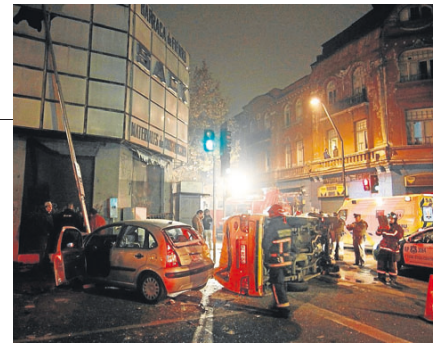
▶ Si bien el número de accidentes creció entre 2010 y 2011, las muertes se redujeron en 22 casos entre ambos años.

"Para producir una reducción aún más drástica se requiere de medidas más fuertes, que son los fotorradarés, son la medida que queda. Otras, como la licencia con puntos, tienen un impacto en el mediano y largo plazo", agrega el especialista. ●