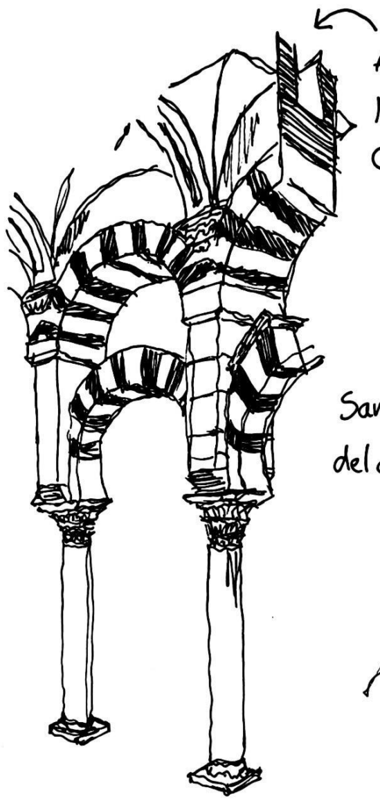
Arquería de la Mezquita de Córdoba.