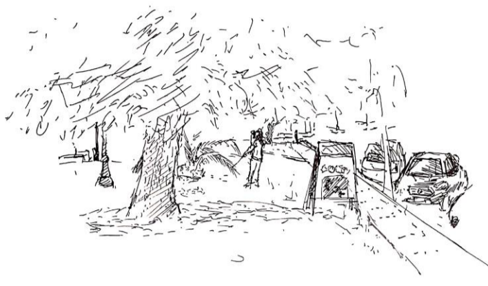
92: Espacio frente/fachada de un edificio, es un antejardín que trae a presencia la tranquilidad y la pausa otorgada por los árboles y el pasto que le restan lo tosco del cemento y asfalto que caracterizan a lo urbano.

espacio frente/fachada de un edificio es un antejardín que trae a presencia la tranquilidad y la pausa otorgada por los árboles y el pasto que le mitiga la dureza del concreto y asfalto que convierten a lo urbano.