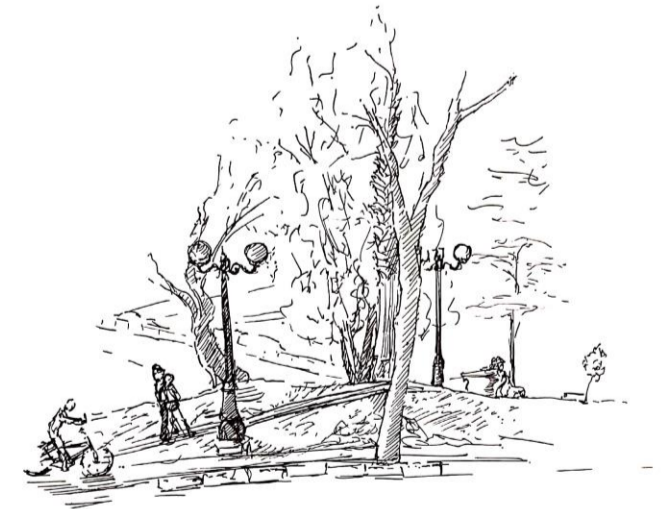
98: Un parque interesante que me encontré esta orgánicamente fusionado con la vereda, ofrece al habitante la pausa y el oír atento, sin interrumpir de ninguna manera el transitar , y lo amplio de un extremo sutilmente se vuelve estrecho, estrechez casi oculta por los árboles, da espacio al oír cercano y tranquilo del transitar

Algo particular de los parques es su microambiente, a pesar de estar rodeados por calles en ocasiones por carreteras (como en este caso) y aún así ser relativamente tranquilos, su extensión y una apertura permite al habitante poder habitar de múltiples maneras el espacio los relieves pueden ser zonas de reposo pero su suavidad no los excluye de ser fácilmente transitables y estos estados de postura dan paso al oír.