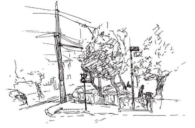
93: En espacios amplios y abiertos atravesables casi en su totalidad de un lado a otro, se presencia la multiplicidad de actividades que en esta vista se proyectan y suceden, todos los sonidos que le otorgan peso a cada suceso, el ver y oír, esta interacción multifacética pareciera construir parte de un posible todo.

Hay un límite entre lo que es parque y todo lo demás sus árboles y su espacio abierto delimitan el espacio en el cual da el reposo y su multiplicidad de encuentros. Este límite no está construido con una muralla, sino todo lo contrario, en una ciudad amurallada lo que se diferencia es la ausencia de esta, los árboles y los abiertos son su muralla atravesable.