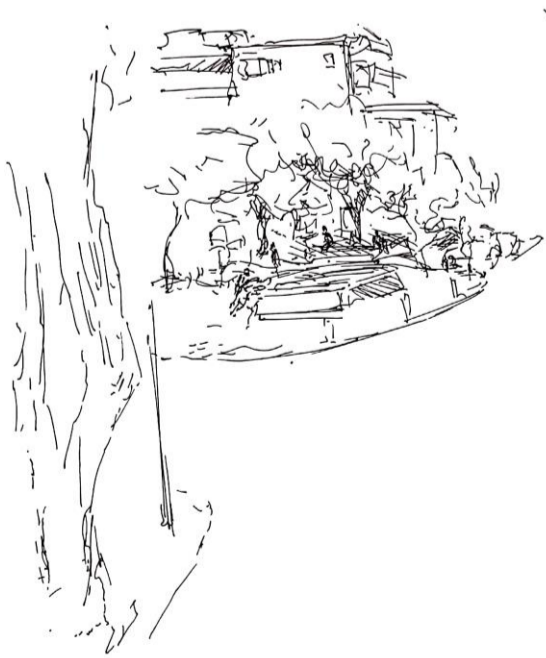
100: Uno de los parques que frecuento al igual que muchos otros tiene a favor la tranquilidad y la posibilidad de pausa que son tan útiles para el oír, en este, se ve que se le suma a eso la sombra, que otorga protección al habitante, sombra otorgada por los numerosos árboles, pero al estar solo en el parque, sigue siendo relativamente iluminado por la reflexión del entorno.

Uno de los parques que frecuento al igual que muchos otros tiene a favor la tranquilidad y la posibilidad de pausa que son tan útiles para el oír, en este, se ve que se le suma a eso la sombra, que otorga protección al habitante, sombra otorgada por los numerosos árboles, pero al estar solo en el parque, sigue siendo relativamente iluminado por la reflexión del entorno.