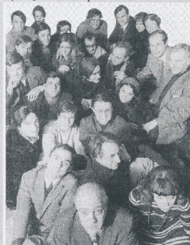
Rue Lamau, París, 1968.