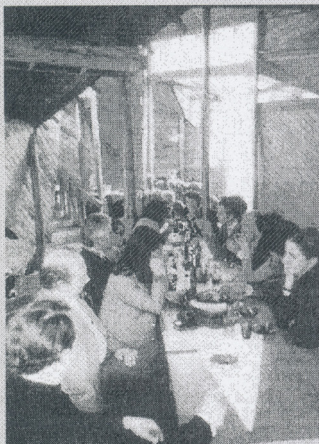
Reunión en hospedería de Ritoque

Rouge" (calzas rojas) y el pañuelo al estilo gaucho que ataba a su cuello.