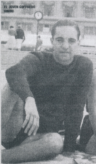
en mar del plata