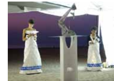
Travesía Purmamarca, 2007