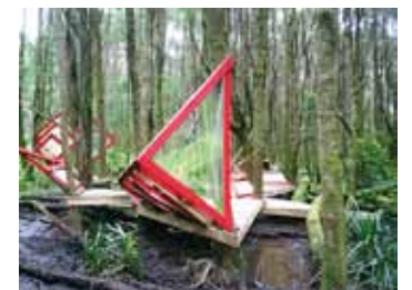
Travesía Mauñín Pangal, 2006