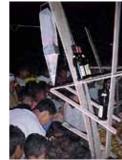
Travesía Quingue, 2000

Las travesías son viajes poéticos que se realizan una vez al año, desde 1984, en la Escuela de Arquitectura y Diseño PUCV. El fin último de la travesía es la construcción de una obra en el lugar, dejando así un rastro del oficio en América.