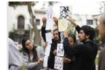
Travesía Lima, 2009

El diseño gráfico en la Escuela, está contemplado desde la observación, que permite al diseñador, mediante un lenguaje teórico desde la Poesía, permanecer en la abertura creativa del oficio;