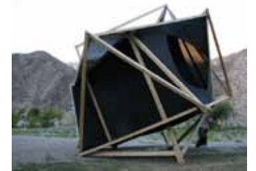
Travesía Alto del Carmen, 2008