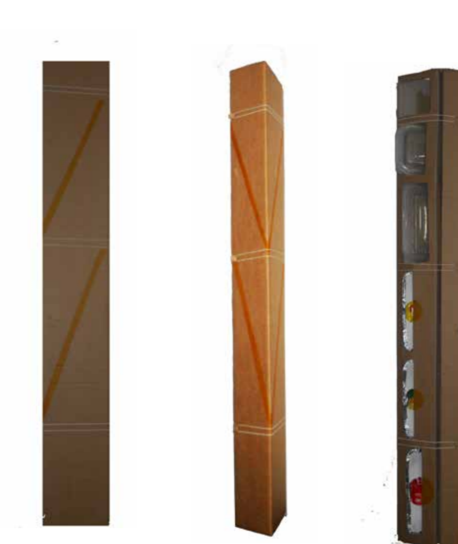
El primer momento del objeto es una vertical que propone la luminosidad a través de sus calados que dejan entre ver sus elementos y sus trazos amarillos.