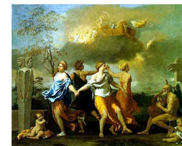
La llegada del "Sol Invictus" en la celebración de las Saturnales.