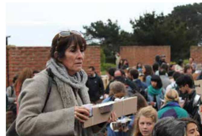
Detalle del gesto que proponía el objeto. Su valor estaba puesto en su distancia

El regalo como lo entendemos no tiene que ver con lo material, existe una dimensión más profunda que es la que le da el verdadero valor a este. Lo efímero del regalar está en la gratitud de lo que se ofrece y como se ofrece, lo que propone y como se materializa. Es por esto que el objeto propone lo efímero sobre la mesa, el momento mágico del encuentro con la luz de la oración y es lo que le da el sentido a este objeto.