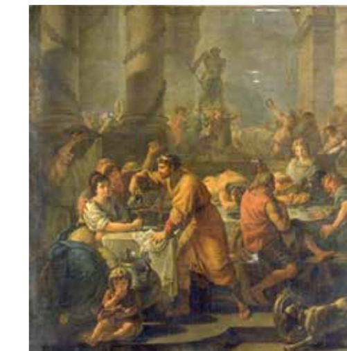
Celebraciones de las fiestas saturnales, las cuales duraban desde el 17 al 23 de Diciembre. Los romanos intercambiaban regalos y visitaban a amigos y familiares

Posteriormente, el nacimiento del Sol y su nuevo período de luz fueron sustituidos por la Iglesia, quien hizo coincidir en esas fechas el nacimiento de Jesús de Nazaret con el objetivo de acabar con las antiguas celebraciones.