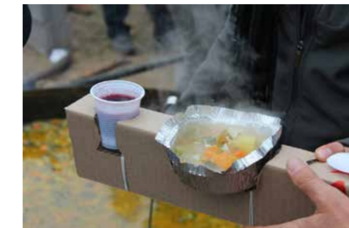
La forma decía del gesto en las personas.