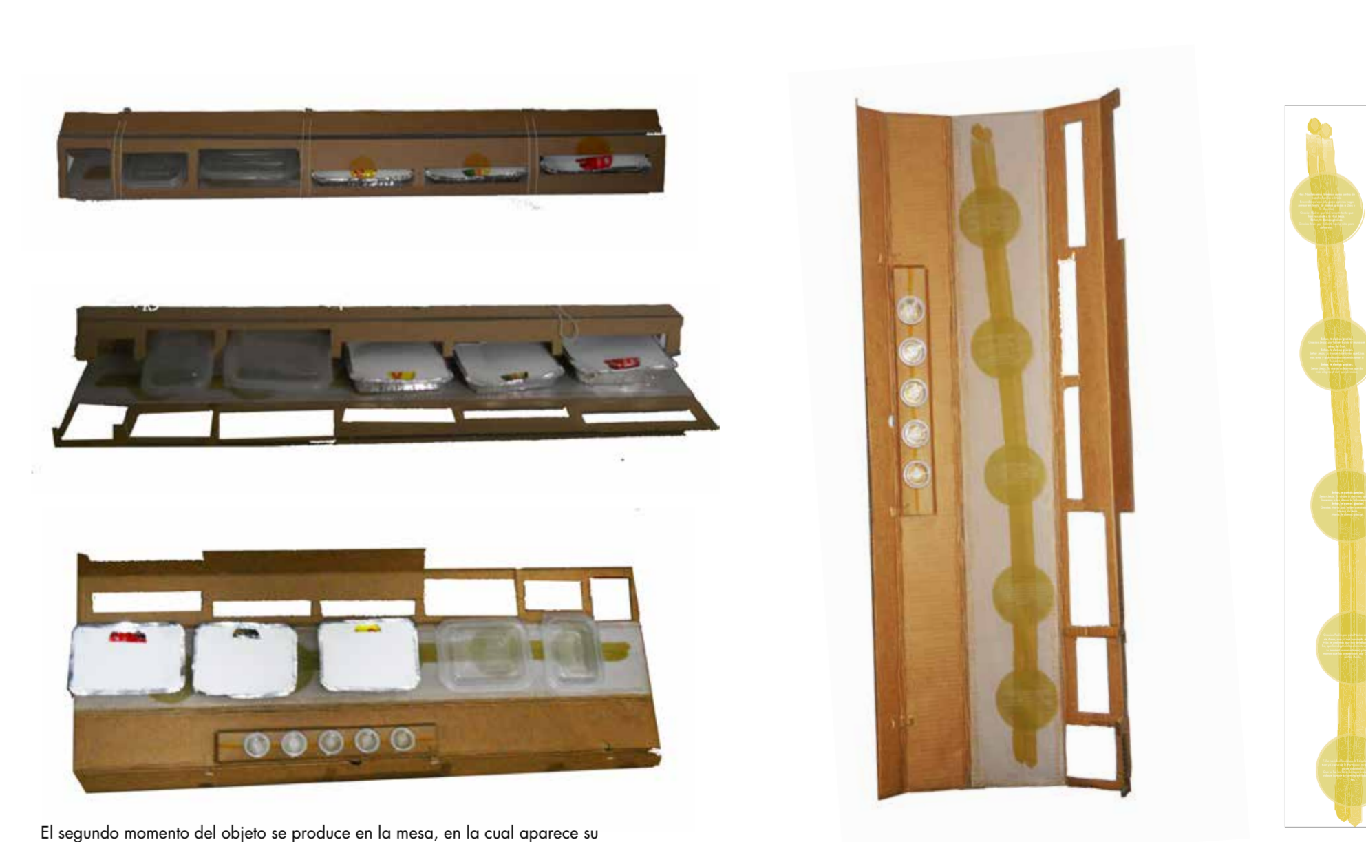
El segundo momento del objeto se produce en la mesa, en la cual aparece su extensión luminosa a través del despliegue que revela la luz del trazado de la oración como acto culmine del objeto y que da inicio a la cena.