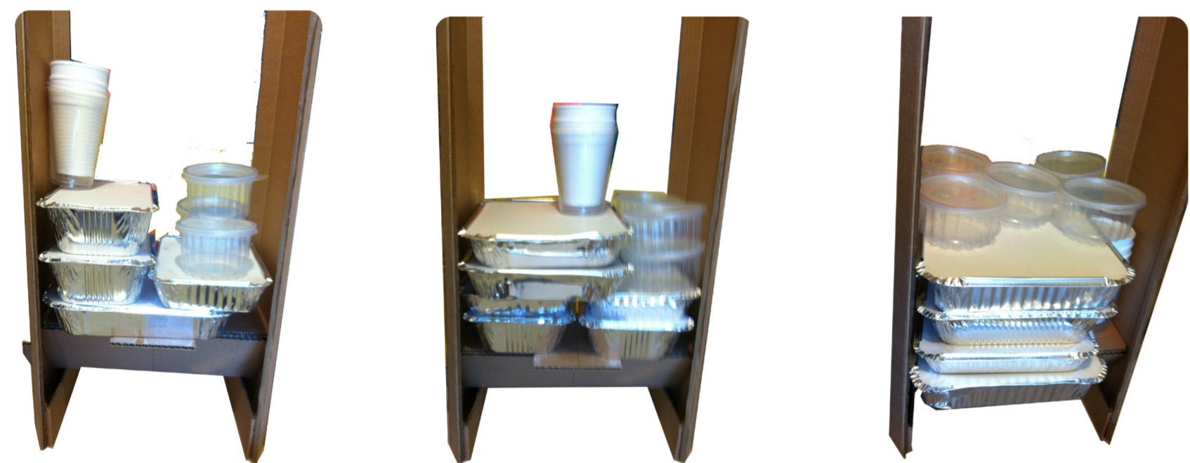
Distintas posibilidades de organización del contenido por volumen que incluyen el menu para 3,4 y 5 personas

La versión final se separa un poco mas del fondo de la estructura producto de la viga triangular , los soportes laterales se vuelven mas gruesos, las vigas superiores se vuelven ajustables para permitir que la estructura se ajuste a una cena que puede ser para 3, 4 o 5 personas, la cinta es mas larga para poder abarcar la totalidad del volumen que se requiera según como se rellene la estructura.