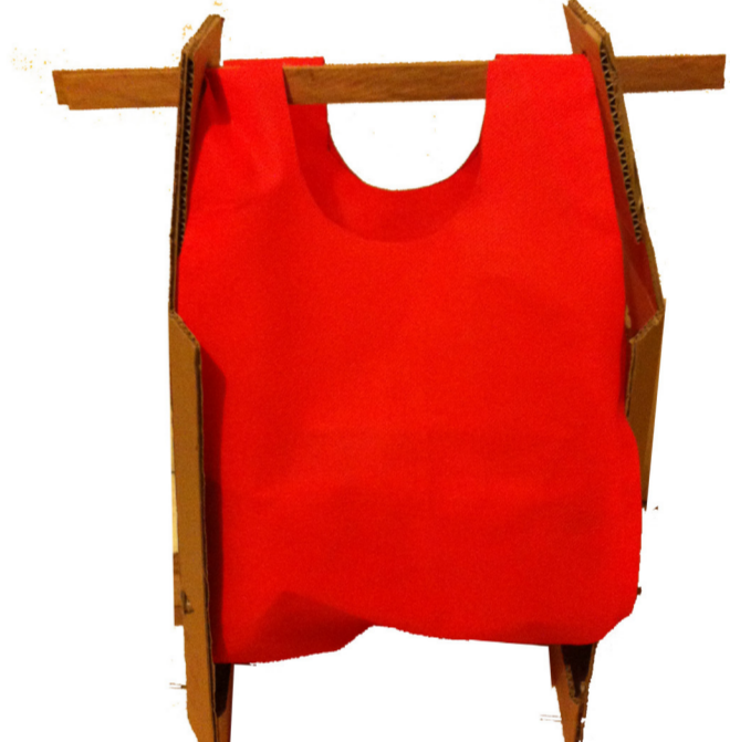
-Prototipos previos de la propuesta que muestran de que manera fue evolucionando el objeto