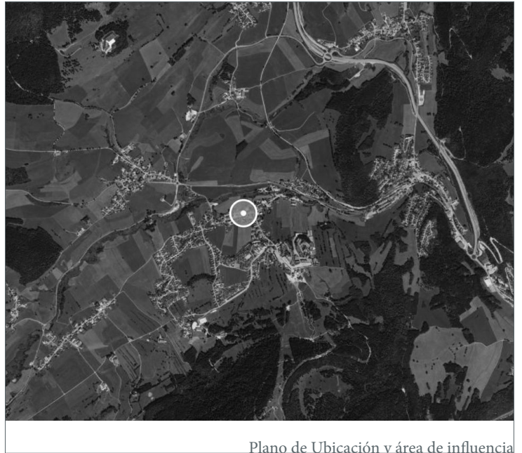
Plano de Ubicación y área de influencia

Participantes: Bandas Número de participantes: 18 Bandas / 24 000 Duración: 2 días