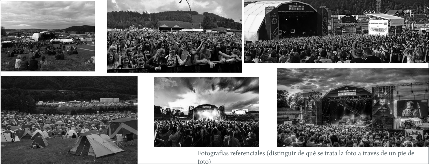
Fotografías referenciales (distinguir de qué se trata la foto a través de un pie de foto)