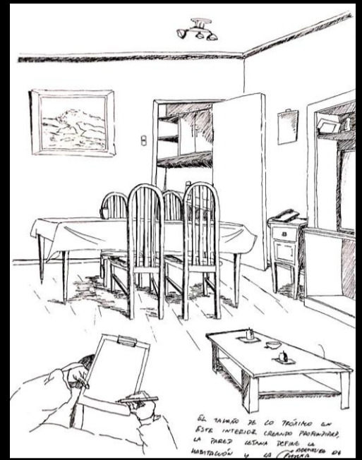
El tamaño de lo próximo en este interior limitado en paredes, creando profundidad desde la pared lejana definiéndose en la abertura de puerta que abre hacia lo distante desde el punto de vista del observador.