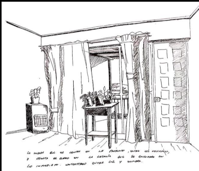
Luz que proviene del exterior y franquea el vidrio, proyectándose en las superficies que contrastan y perfilan el interior y lo próximo hacia el observador.