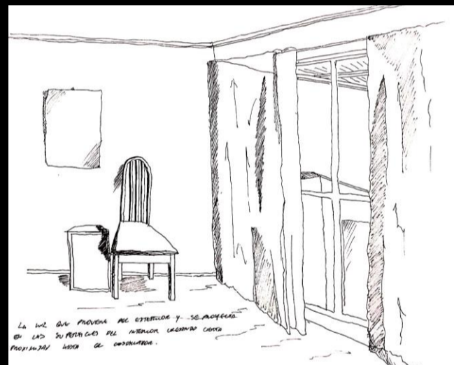
La transparencia del límite que conforma la ventana y define el interior de el comienzo del exterior que se profundiza en la lejanía comparativa a la cercanía del confín interior