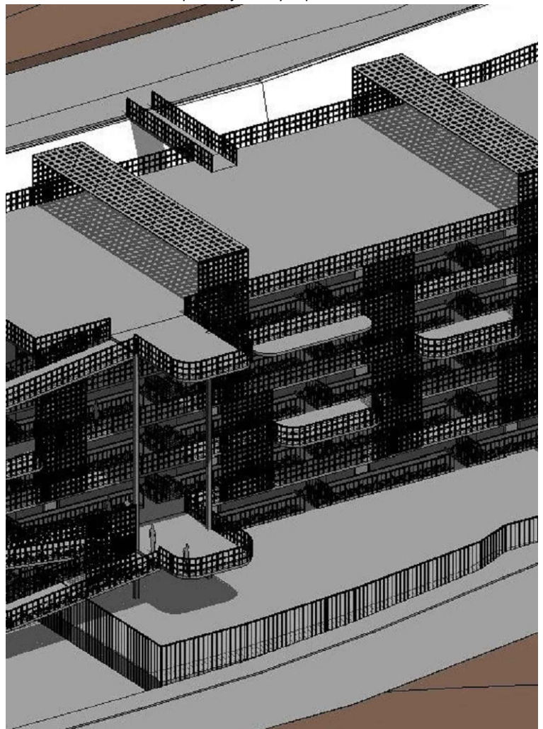
Celosías verticales y pérgolas