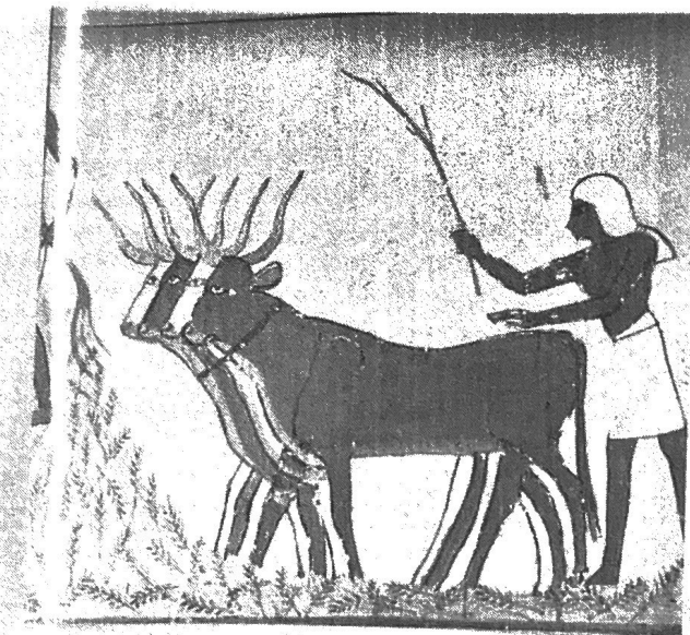
② Vacas y Bueyes iguales