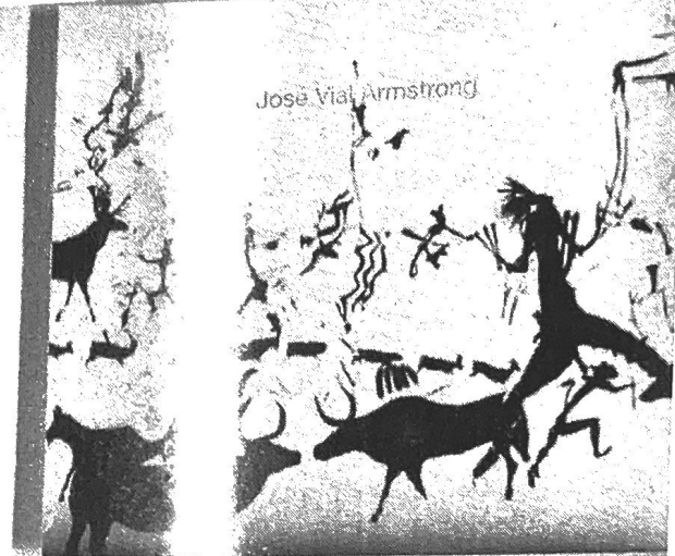
② Indiferencia a la mala relación de tamaño entre hombre y animal. a la escala de la vida de la ciudad de la ciudad de la ciudad